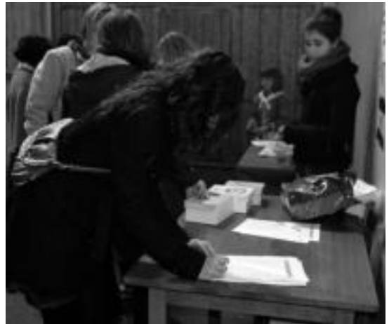
Larunbatean pilotalekuan jarri zuten sinadurak biltzeko mahaiak.

Udaleko arduradunek azaldu dutenez, ordea, ez dute etsiko eta, «egoera honek herritarrei sortuko liekeen arazoez eta eragozpeenez jabetuta» ahal duen guztia egingo duela esan dute.