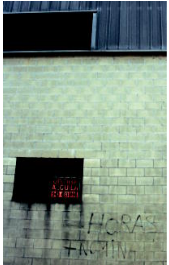
Tolosalako Usabal industriguneko bi lantegi. A. IMAZ