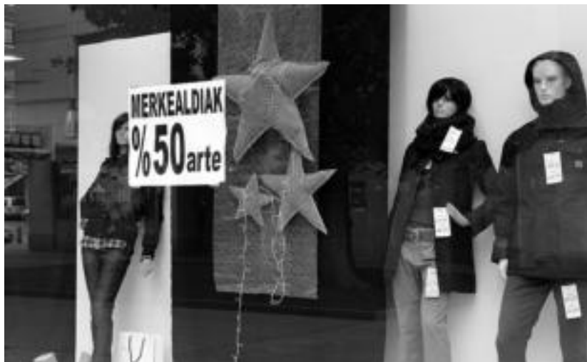
%50a bitarteko beherapenen eskaintzak ikus daitezke Tolosako erakusleioetan. I. URKIZU