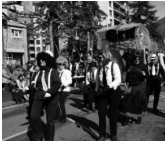
Pixkana-pixkana inauterietarako prestatzen ari da Tolosa. I. URKIZU

Aurkezten diren lanek Tolosarekin eta txosnekin zerikusia izan behar dute, eta paper euskarrian nahiz euskarri digitalean egindakoak izan daitezke. Paper euskarria bada, sorkuntzak 10 zentimetro x 10 zentrimetro neurrikoa