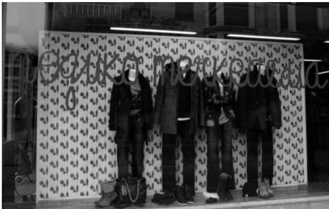
la denda gehienetan, pasa den astelehenean hasi zen, otsaila bukaerara arte luzatuko den merkealdia. I. URKIZU