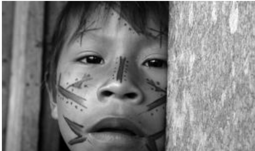
Liburua dibulgazio lana da, eta Sucumbioseko indigenen bizimodua islatzen du.