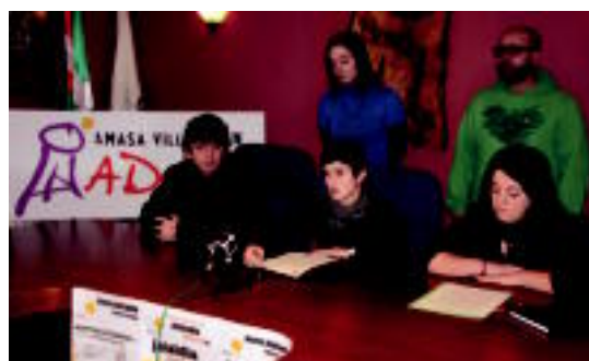
Herriko hainbat eragilek aurkeztu zuten, ekimena, atzo.

Berria Komunikazio Taldeari laguntza eman nahi diote; Euskarari ados! lantaldeak hitzaldia, erakusketa eta jaialdia prestatu ditu o4