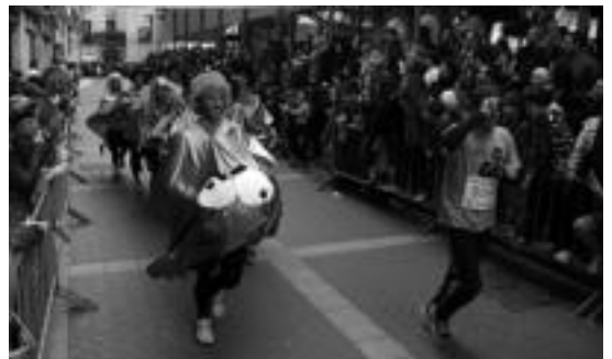
Inauteriak aurreratu zituenik izan zen Tolosan. I.G.L.