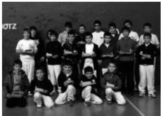
Gabonetako pilota topaketen finalista, Ikaztegieta.