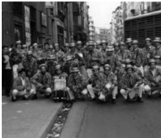
Astelenita egunez irten ohi dira kalera, txaranga ofizial gisa. HITZA

Letrarik osatzen ez zutela eta, beldurtzen hasi ziren, kideetako batek «nola-hala guk geuk bukatuko dugu», esan zuen arte. Abestiaren zati baten inguruan ari zirela, norbaitek «no tiene miedo, no tiene miedo, no tiene miedo, no tiene miedo» jarri zero, ondo ematen zuela proposatu zuen, eta