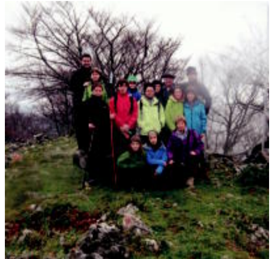
Lizartzarrek Otsabioko tontorra zapaldu zuten. HITZA