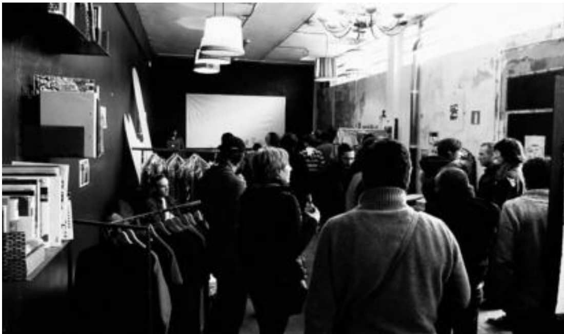
San Esteban auzoan BOX. Ak duen tailerraren azpian egokitu dute sormenari eskainitako gunea. HITZA