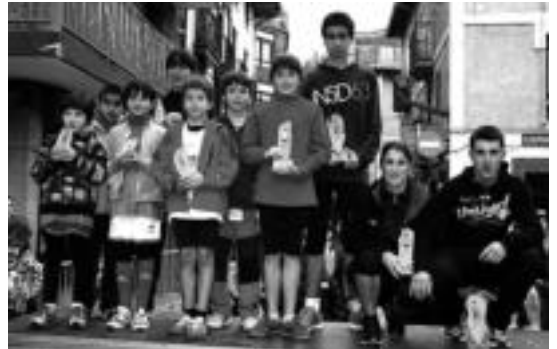
Alegiako San Silvestre lasterketako podiuma. HITZA