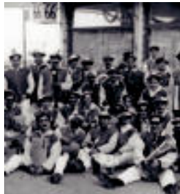
Liburuan ikusi daitekeen irudia. HITZA

Belaunaldi guztien historia jasoz 'La charanga Poca Tripa no tiene miedo' diskoa eta liburua egin dituzte ◦3