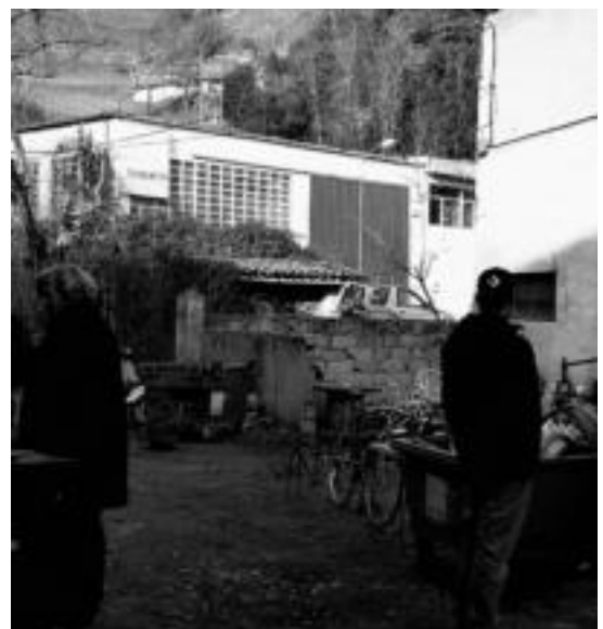
Azken asteotan hainbat jarduerak burutu dituzte jada. HITZA