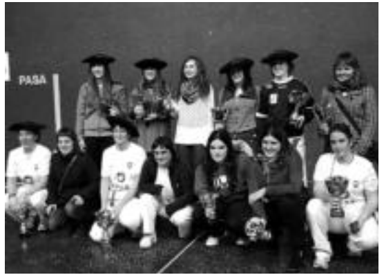
Ezker Hormako Emakumea Pilotari Txapelketako finalista.