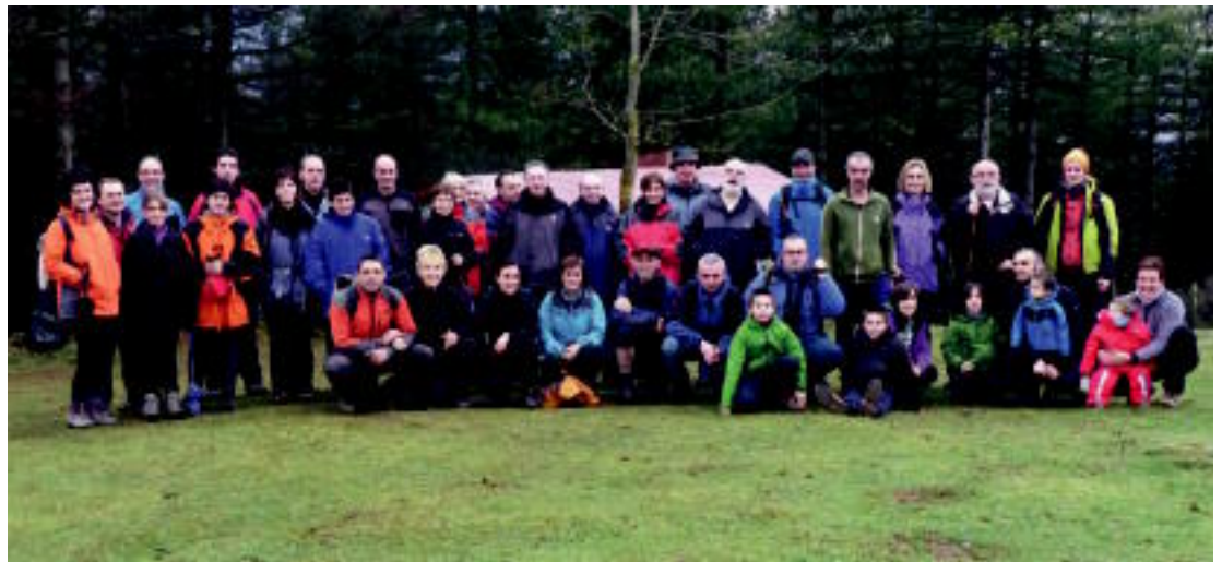
Amasa-Villabanoko Aizkardi mendi taldeko kideak, urtero moduan, Loatzo mendira igo ziren. HITZA

HITZAK ez du bere gain hartzen egunkarian adierazitako esanetan etairitzien erantzukizunik.