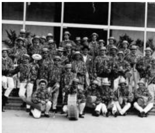
Piñata igandean lurreamendi egoitza bisitatzeko dute urtero.