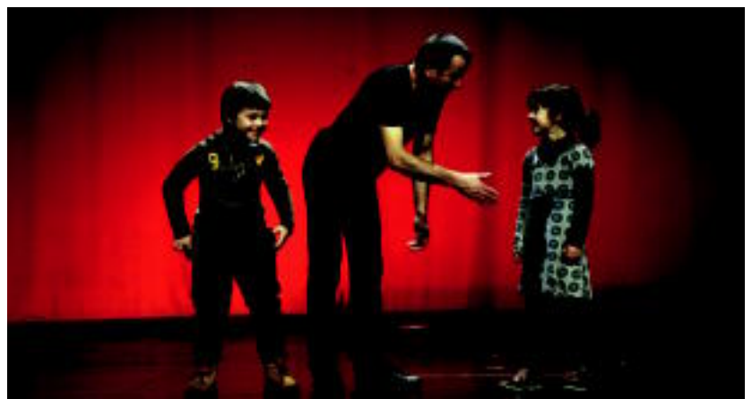
Txan magoak harri eta zur utzi zituen atzo haur nahiz helduak, Leidor aretoan. I.T.

Alegian, hala ere, Gaztetxearen 25. urteurrena ospatzen jarraitzen dute eta bihar play-back saioa egingo dute 22:00etatik aurrera. Anoetan, gaztetxearen baita, The Joseans eta Foxy Leiners taldeen kontzertuak entzun ahal izango dira, 23:00etan, bihar.