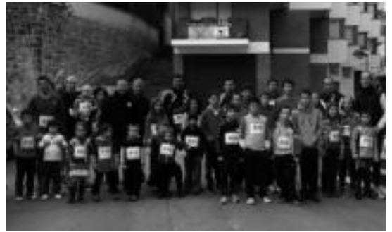
Lizartzan haur eta helduak lasterka aritu ziren astelehenean. HITZA