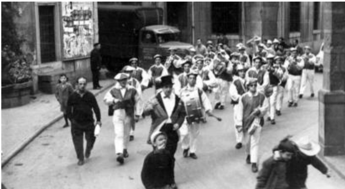
1963an sortu zen Tolosako Pocá Tripa txaranga, eta irudi zahar nahiz berriez hornitu dute, urteurrenaren harira argitaraturiko liburua.

Mende erdia beteko du Pocá Tripa txaranga, inauterietan. Belaunaldiz belaunaldi pasaturiko lekukoaren ibilbidea, disko eta liburu batean bildu dute kideek.