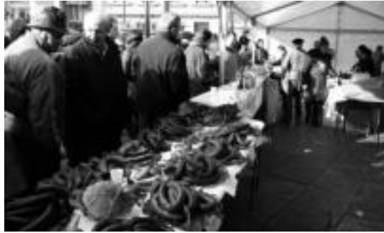
Odolki egilerik onenaren izena 13:00etan esango dute, Trianguloan. A. IMAZ

San Frantzisko pasealekuan, era guztiak jaxiak egongo dira salgai: ahatekiak, kontserbak, gozoak, eztiak, gazta... Jakiez gain, artisauek landutako lanak ere izango dira: pilotak, bitxiak, egurrezko jostailuak, oinetakoak,