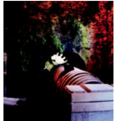
Alain Montillaren erakusketa ikusi daitezkeen zenbait lan. HITZA