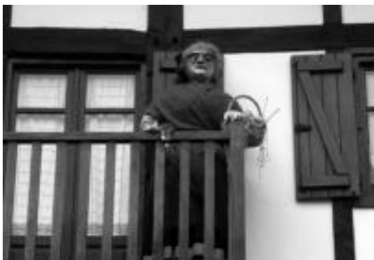
Leitzan Orantzaroren irudia herriko balkoietan jarriko dute. HITZA

Gure arbasoen ohiturak indartze aldera, aurrean ere, Orantzaroren enborra erreko dute leitzarrek, abenduaren 24an.