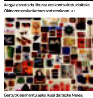
Argia esnatu da liburua ere kontsultatu daiteke Okinaren erakusketara sartzerakoan. s.c.