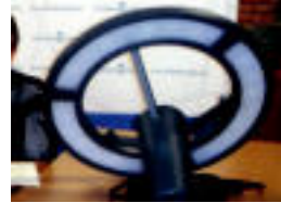
Jarriko duten argietako bat. HITZA

2020. urterako 20-20-20 helburua lortzeko plangintzari dagokionez, plangintzak udal kudeaketaren arlo asko ukituko dituela esan du udalak. «Udal eraikinak eta ibilgailuen fota, mugikortasun eredua, hondakinen kudeaketa, hirigintza eta birgaitze ereduak, laguntza fiskalak eta kon-