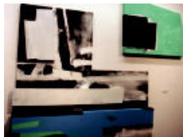
Baldaren horma irudi handiak ere ikusi daitezke Aranburun. s.c.