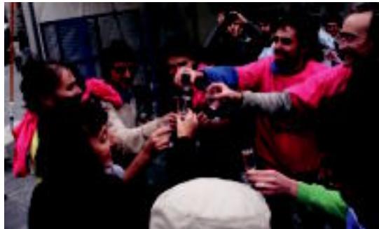
Trianguloan, larunbatean, topa egin zuten lekukoa pasatzerakoan. I.T.

Hori bukatuta, Villabonan, LAB eta ELA sindikatuarekin batera AHTaren lan baldintzei buruz-