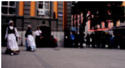
Tumbotiki plazari izena aldatu eta Emakumeon Plaza izena jarri dio Tolosako Udalak. ||

• Bidea. Ius larunbatean eginiko flashmobak.