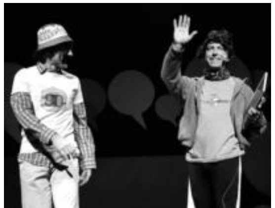
Hainbat irakaslek parte hartu zuten esketxetan. I. URKIZU

Arropa, berriz, desfileen bitartez erakutsi zieten bertaratuei. Haurrak eta gaztetxoak aritu zi-