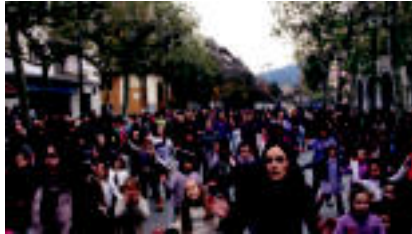
Dantzarako gogoak jende ugari hurbildu zen Triangulora, flashmobean parte hartzen. ||