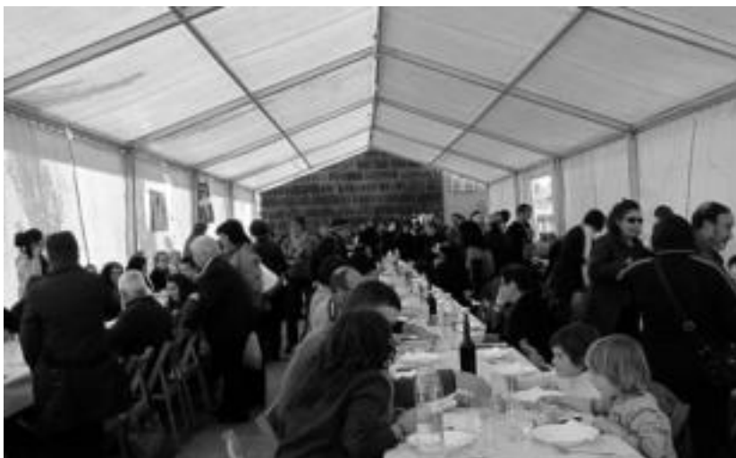
Urtero bezala, jai giro polita izango da Ibarren igande goizean. HITZA