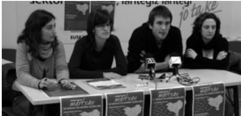
LABeko eta ELAko ordezkariak, agerraldiaren une batean. iGL

Hainbat eskari plazaratu nahi dituzte. Batetik, «aurrekontu, gizarte eta industria politikek enplegua sortu behar dute eta ez suntsitu», diote sindikatuek, eta zerbitzu publiko unibertsalak bermatu behar dituztela. Lan produktiboa zein erreproduktiboa banatzea eskatu dute. Espainiako Gobernuak Hego Euskal He-