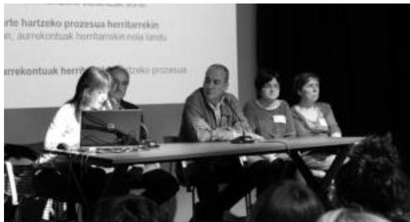
Pasa den urriaren 2an izan zen 'Herritarrekin' egitasmo lehen saioa Tolosan. LURKIZU

Etzeko lanak. Etxeko lanak egin edota haurrak zaintzeko, emakume euskaldunak bere burua eskaintzen du. Autoa badauka. 943 69 68 82 edo 606 52 19 92.