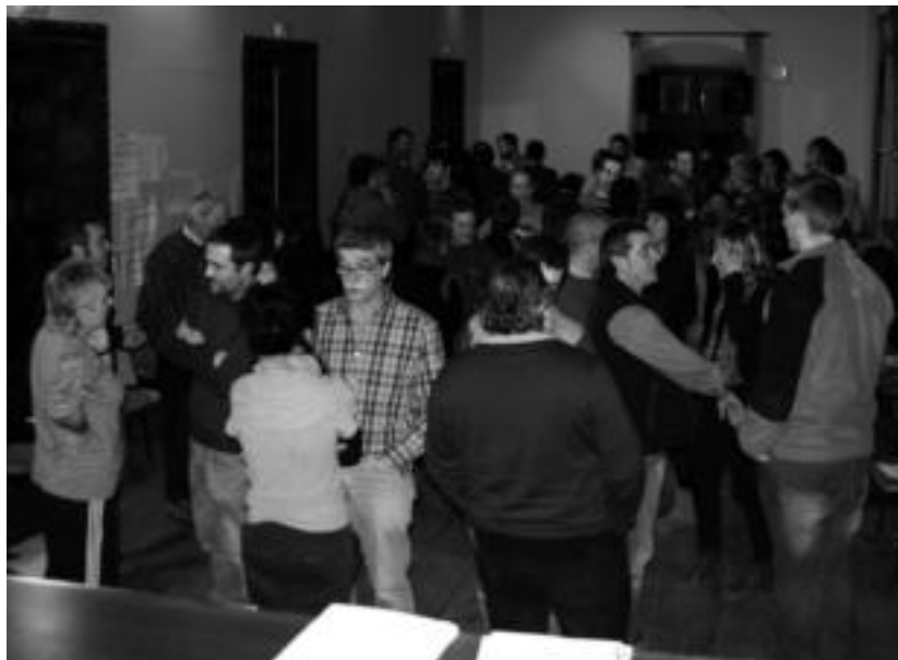
Goierriko eta Tolosaldeko Sorturen dinamizatzaileak Ordizian, larunbateko batzar «dinamikoa» prestatzen. HITZA

Gomendiotik gomendiora, behin eta berriz azpimarratzen dute parte hartzearen garrantzia Sortu prozesuaren dinamizatzaileek: «Iraultza demokratikoa martxan jartzeko bitarteko gisa, herri honen askatasunerako tresna baino ez dugu izan nahi. Euskal Herriaren independentzia eta sozialismoa eraiki nahi duten gizon eta emakume orori, gazte zein helduei, Sortu prozesuan parte hartu dezaten eskatzen diegu. Prozesu herritarra burutu nahi dugu, eta horretarako herritarrekin batera egin nahi dugu bide».