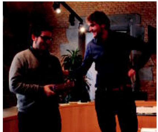
Bozka eman zuten herritarren artean zozketa egiten dute urtero.

Bueltaka ibili ondoren, ordea, azkenean aukeratu dute, 2013ko