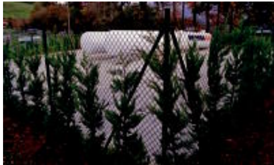
Goiazko hilerriaren ondoan jarri duten gas biltegi berria. HITZA

Biltegi zaharretako bat Txinkorta eskolaren ondoan, Bidanian, dago. Bestea, Goiazko elizaren parean dago, errepidearen bestaldean. Goikoetxeak azaldu duenez, 2006an hasi zen martxan proiektua. «Txinkorta ikastetxea handitzeko aukera ikusita, ondoren zegoen biltegia lekuz aldatzea aurreikusitua zen. Hortik abiatu zen proiektua». Goiazko hilerriaren ondoan jarritako biltegi berriak herri guztiari banatuko dio gasa, hau da, horretarako azpiegitura duen eraikin guztiak. Biltegi berriaren edukiera aurrerantzean herrian egin daitezkeen etxe be-