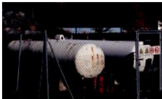
Egun Bidanian dagoen gas biltegi zaharra. IGL

rriek gasa banatzeko adinakoa da. Lehenengo fasea aurreko legealdian egin zen. Orain, bigarren fasea egin da, hau da, biltegi berria egin eta egun dagoen azpiegitura berri lotzea. Udalarantz 71.000 euro inguruko kostua izan du.