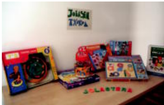
Herriko liburutegian jarri dute jolasen txokoa. IGL

egingo da. Erregistro bat osatuko da jostailu bakoitzeko eta haurrek etxera eraman ahal izango dute hamabost egunez. «Gabonak datozela eta, une aproposa irudituzte egitasmoa martxan jartzeko», esan du Lasak, eta gai-