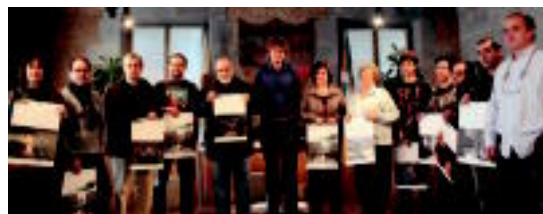
Aukeratutako argazkien egileak, udaletxeko batzar aretoan.

Bihar da Tolosa Gasak eta Tolargik egiten duten egutegia hartzeko azken eguna 04