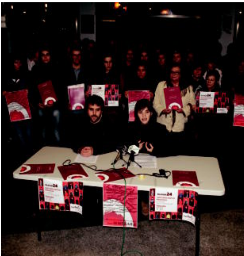
Tolosako Zerkausian aurkeztu zute, herenegun iluntzean, Tolosako Sortu.

Lehen batzarraren ondotik, beste hiru etorriko dira, I. Kongresua iritsi bitarte; larunbatean indar politiko berriaren perfil politiko-ideologikoa zehaztuko dute 03