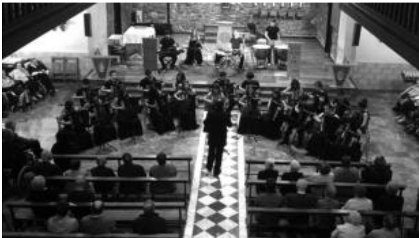
Isitxo Larrañaga Akordeoi Orkestrak emanaldia eskaini zuen iragan ostiralean, lurreamendin. HITZA