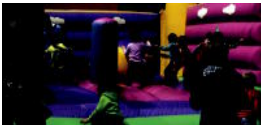
Anoetako frontoian jarritako Kiliklon jolas parkea. JONE AMONARRIZ