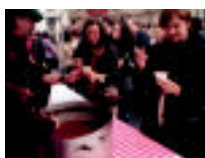
Babarrun errazioak banatu zituen kofradia. ...