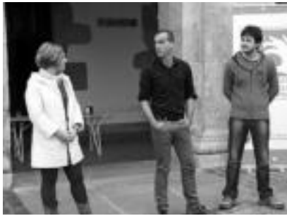
Azken edukiontzi berdea erretiratu zuten Orendainen larunbatean. Ugalde, Egia eta Errazkin, eskuinean. I.G.L.