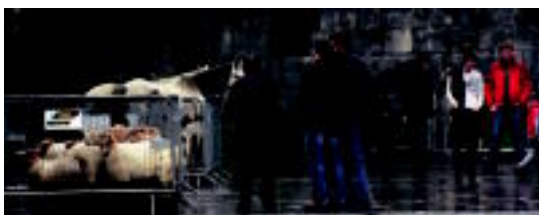
Amezketako azokan abereak ere ikusi ahal izan ziren. JONE AMONARRIZ