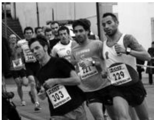
135 parte hartzaile izan zituen herri krosak.