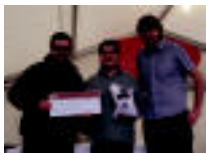
Porrua jatetxeak irabazi zuen lakariaren enkantea. ...