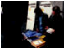
Berriaguena egitasmoaren mahaia jarri zuten. ...