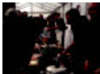
Lehiaketa gastronomikoa lortu zutenak. ...