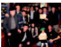
Txapela Nork Hobeto Jantzi Lehiaketako sariak. ...