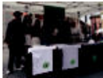
Udaberri dantza taldearen bere postuak. ...