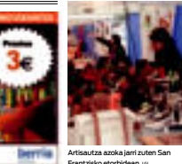
Artisautza azoka jarri zuten San Frantzisko etorbidean. ...