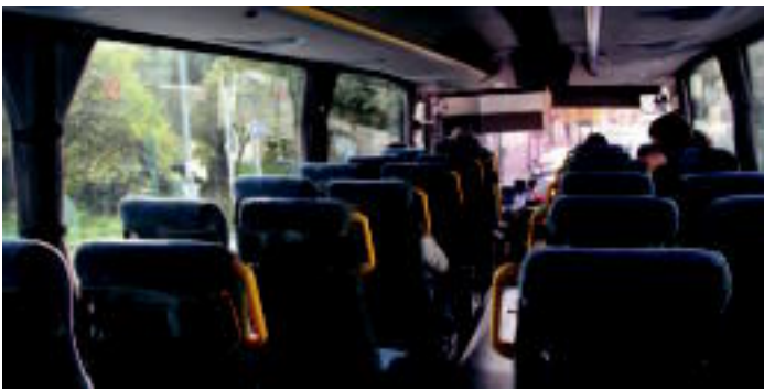
Egun eskualdeko garraio publikoa, errepide bidez, Tolosaldea Bus enpresak ematen du...