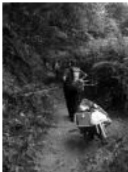
Auzolanean, Leaburun. HITZA

Bada, etziko deialdirako ere herritarrek animatu nahi dituzte. Udalak hamaiketako eskainiko die parte hartzen dutenei, eta lanerako makinak ematen dute nentzat gasoila ere udalak jarriko du. Parte hartzaileen laguntza eskertu dute aldeaz aurretik.