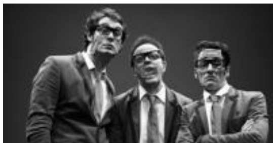
Ticket antzezlaneko kideak. HITZA

Egileek diotenaren arabera, umorezko zinemaren historian zehar bidaiatzea modukoa da an-