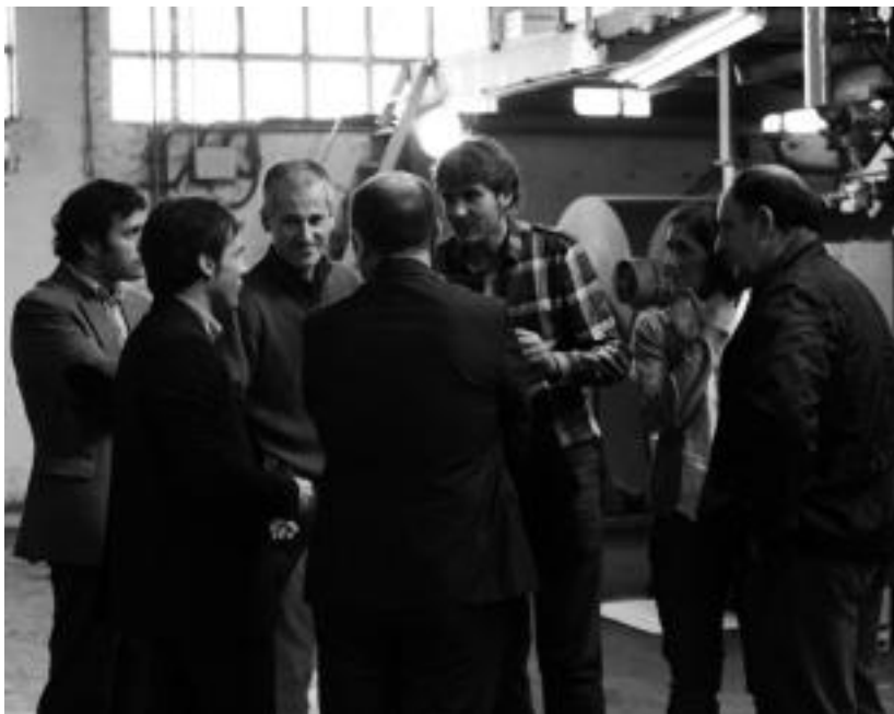
Lantegia erakutsi zieten foru aldundiko nahiz udaleko ordezkariak. I. URKIZU

Gaur egun krisiak esparru guztiak hartzen dituen arren, 80ko hamarkadan ere ekonomiak izan zuen gainbehera. Izaera aldaketa bat ekarri zion honek enpresari, eta Limousin familiarena izateari utzi, bertako langileen jabetzara pasa zen erakundea. Orduan hasi