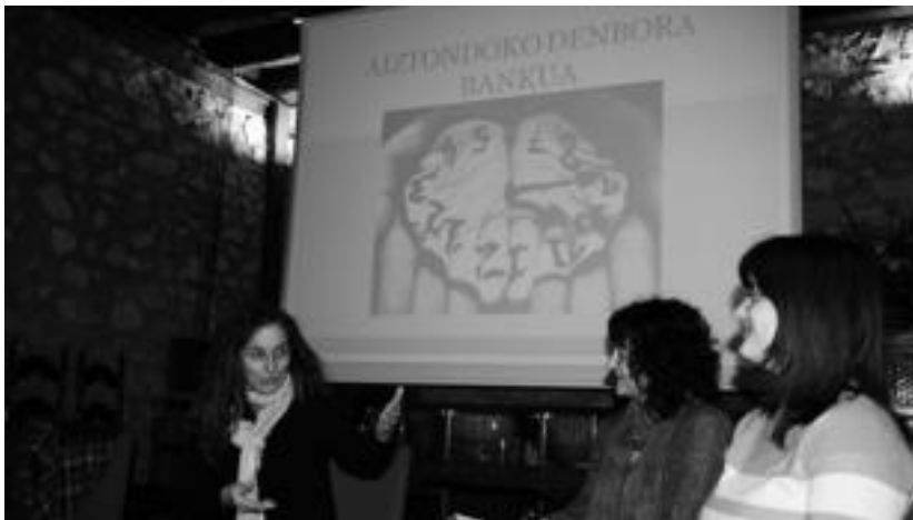
Aiztindoko Denbora Bankuko kideak Asteasun, herritarrei egitasmoa azaltzen. A. IMAZ