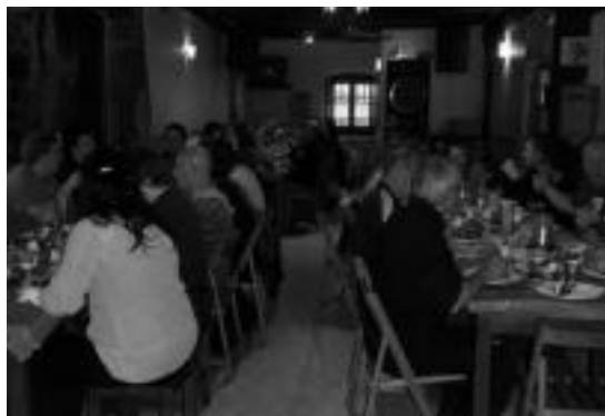
Aurten ere 60 lagun inguru espero dituzte bazkarian.

Festa 14:00etan hasiko da, izan ere, azken bi urteetan egin duten moduan, afariaren ordez bazkaria egingo dute. Saltxitxa alemaniarrek, patatak purearekin, txekor sailheskia letxugarekin, limoi eta kaba sorbetea, kafea eta kopa izango dute menu moduan bazkaltiarrek. Horrez gain, garagardo festa izaki, hamar garagardo desberdin dastatzeko aukera izango dute. Antolatzaileek azaldu dute 60 lagun inguru espero dituztela bazkarian. Bertarako txartelak