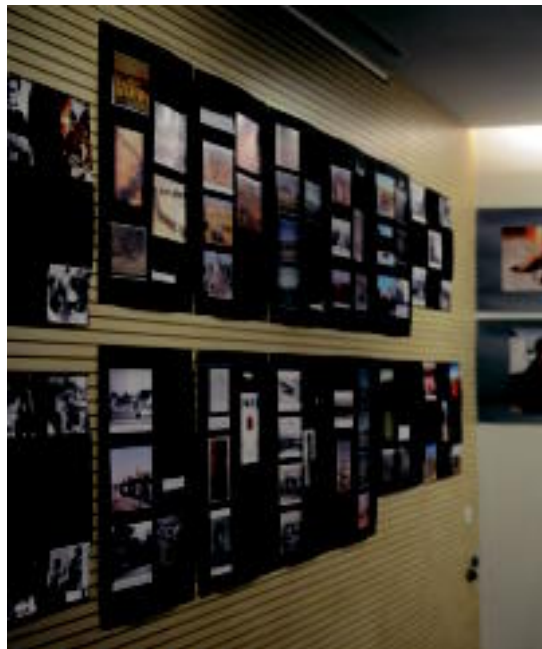
Hainbat paneletan Saharari buruzko informazioa ematen da erakusketan.