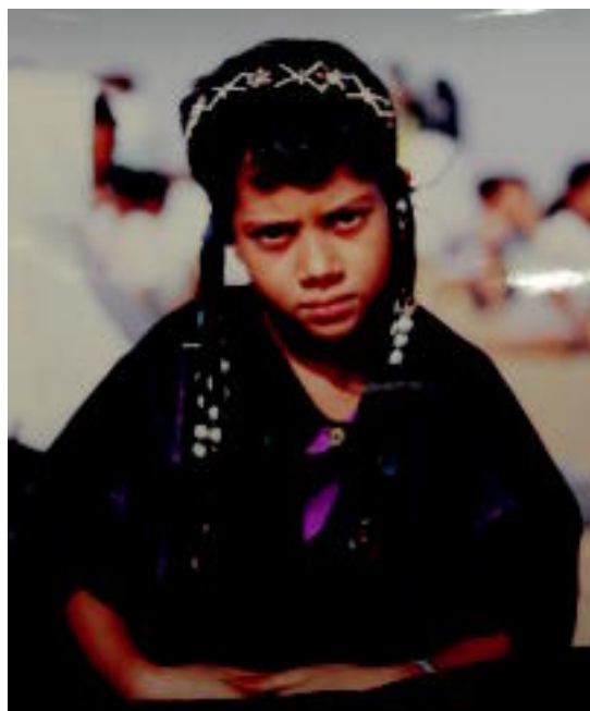
Saharari buruzko erakusketaren argazkietako bat. OTHMANE DEDAH