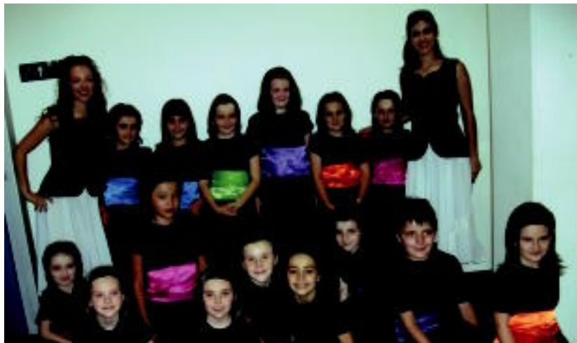
Anoetako dantza eskolak 72 ikasle ditu; Mikelasagasti auditorioan elkartzen dira guztiak.