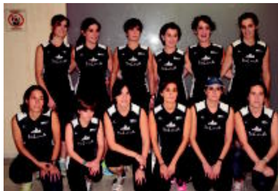
Honekin taldearen aurkezpena egin berri dute, Usabalen. I URKIZU

Horrela, emakume korrikalari zenbait asteartero eta ostegunero elkartzeko dira, Berazubi estadiora. «Lotsa alde batera utzi, eta ki-