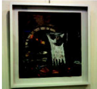
Askotariko materiala erabiltzen du. Ezkerrekoan, esaterako, ezpainzapi bat. Eskuinekoa paisaia bat da. I.T.