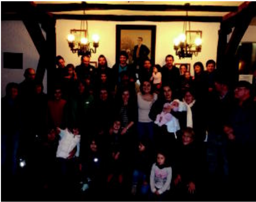
Zorionak! Zorionak etxeko eta lagunen partetik. Maitte zaitugu!