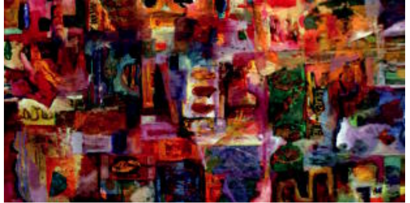
Artista ibartarrak eginiko obra abstraktuaren adibide bat. I.T.

Longaron tolosarrak bere ikaslearen pintatzeko moduez egin duen gogoetan irakur daitekeenaren moduan, «barrutik, bere pentsamendutik ateratako margolanak dira». Urrestarazuk berak ere aitoritzen duenez, «pintatzeko unean duzun aldarrearen arabera, emaitza bat edo beste izan daiteke». Askatu egiten da, pinturak, «libreago» sentitzen da, eta oso gustuko duen bere lanetakoren batean buru belarri ari de-