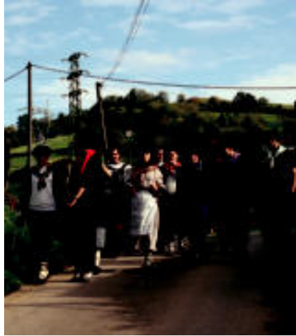
Goizean, eguraldia lagun, kalejiran etxe etxe ibili ziren; arrautzak jaso zituzten etxeetan. E. MAIZ

Asteburua ere ekitaldiz bete-betea dute, eta bada zer ikusia. Baina San Martin jaiak ez dira Amasan bakarrik ospatzen, Alki-