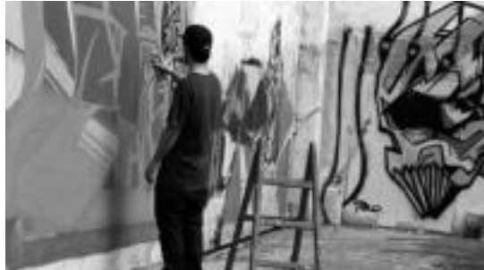
Skate lehiaketarekin batera, graffiti erakustaldia izango da bihar.