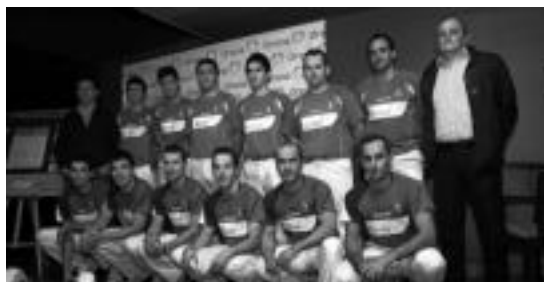
Zeberio II.a elduindarra eta Aizpuru II.a tolosarra, eskuinean. M. ANDRES

Txapelketaren sistema erabat berritzailea da. Lehen fasean, bi-