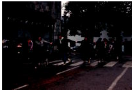
Arratsaldean, dantza emanaldia eskaini zuten. E. MAIZ