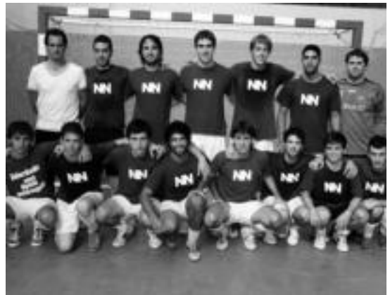
Ibarra areto futbol taldeak zazpi partidatik zazpi irabazi ditu. TXEMA VALLÉS

Larunbatean Usabalen, Javi ordezkaria, Aitor entrenatzailea, Endika, Telleria, Murgi, Belloso, Etxebe, Ekhi, Vazquez, Zumeta, Alonso eta Aratz izan ziren. Bigarren taldeari dagokionez, Santxoren mutilek 4-2 irabazi zuten Horbel Tabernaren aurka, eta bigarren postuan dira liderraren puntu kopuru berdinarekin.