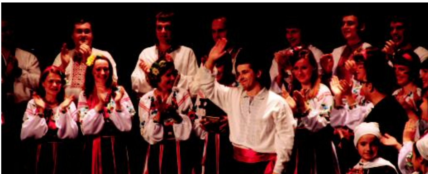
Ukrainako taldeak irabazi du Tolosako 44. Abesbatza Lehiaketako sari nagusia; irudian abesbatzako zuzendaria, hunkituta, saria jaso eta gero.