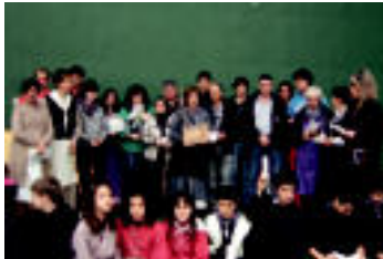
Berastegiko azokan hainbat lehiaketa izan ziren, eta banatu ziren sari guztien irabazleak ikus daitezke; ikasleek ere beraien postua jarri zuten azokan. 11/24