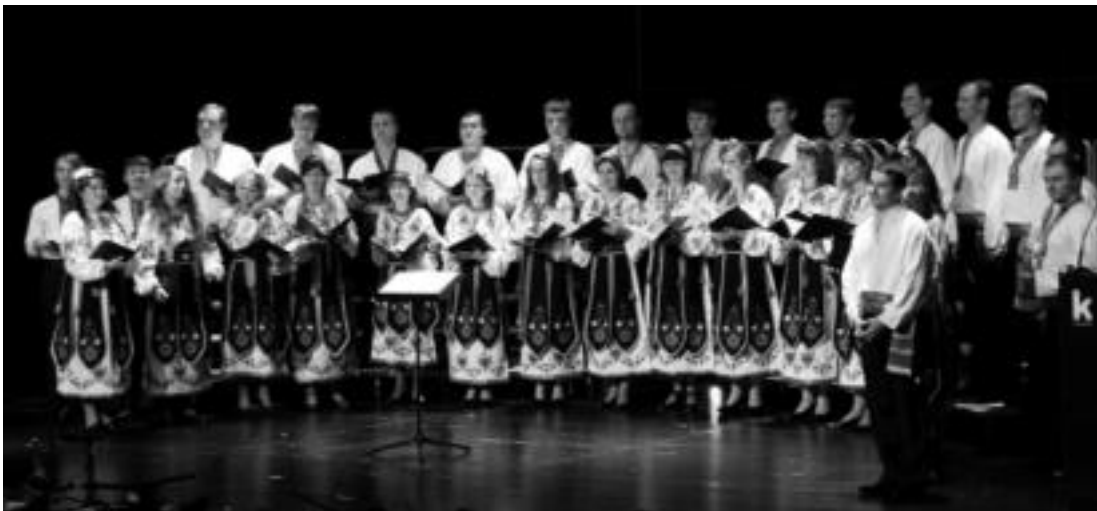
Ukrainako Credo ganbera abesbatzak lau sari eskuratu ditu, eta tartean Kutxa Sari nagusia ere bai. JONE AMONARRIZ