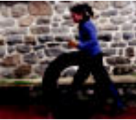
Helduek eta haurrek karniol gurpil igoeran parte hartu zuten, Alkizan. 11/24