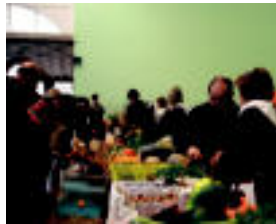
Pilotalekua postuz bete zuten, Amasan. 11/24

Alkizarrek ere, asteburu hau festaz bete-bete eginda izango dute. Txerri harropaketa, giza proba, karta jokoa, sokatira, hazkaria edota pilota izango dituzte.