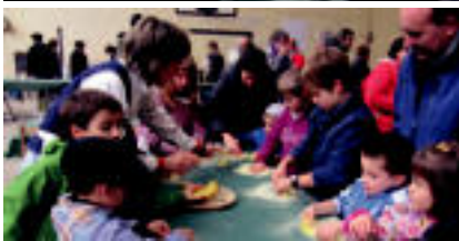
Jende asko hurbildu zen Bedaio azokara; txikienek taloak egiten ikasi zuten. 11/24

Jatekoaz gain, artilea egiteko teknika, arizko eta artilezko lanak, kondroak, makilik, sagardoa egitea... izan ziren. Oñatiak arte nahiko talo eta gaztain jan ahal izan zuten jendek.