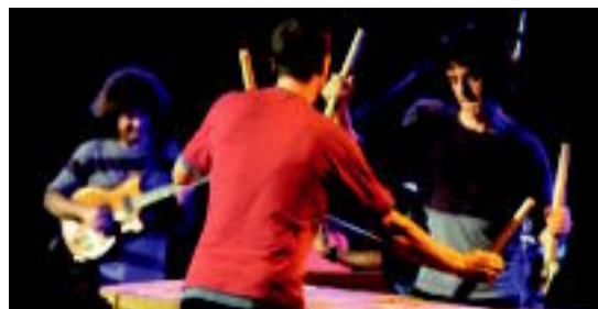
Oreka TX taldeak joko du galan, beste talde batzuekin batera. HITZA

Honen harira, gizarte osoarekin elkarlanean aritzea oso garrantzitsutzat dute elkartearen kideek, «eta horretarako komunikazio sistemarik eraginkorrenak erabiltzea beharrezkoa da».