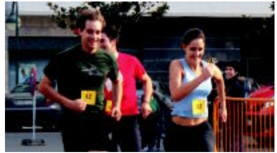
laz ere herri krosa egin zuten Kultur eta Kirol Astearen barruan. HITZA

Igandean ere jarriko dute jolas parkea, eta egun osoko sarrerak 10 euro balio du, egun erdikoak 6 euro, eta bi egunetan joan nahi duenak 18 euro ordaindu beharko ditu.