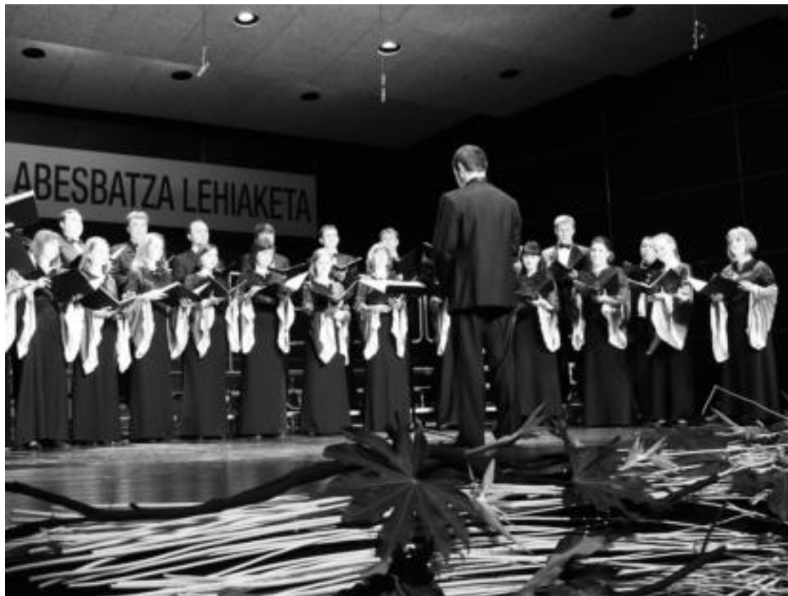
Polifonia sailean abestu zuten Credo abesbatzako ukrainarren publikoaren harrera ona izan zuten Leidorreko saioan. I. URKIZU