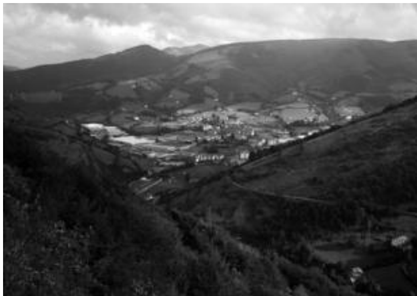
Mendialdea mankomunitatearen barruan dago Leitza.

Herriak mankomunitateak sortuz elkartzan dira, zerbitzuak emateko. «Sortzen joan ziren ga-