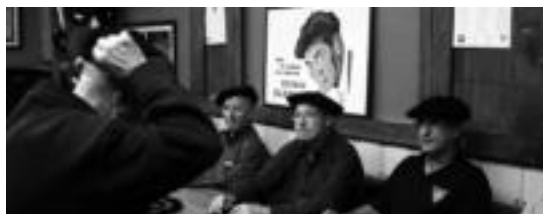
Hamalagarrenez antolatuko dute txapelketa. R. CALVO

Azaroaren 17an, 12:00etan hasiko da lehia, Txinparta elkarteak