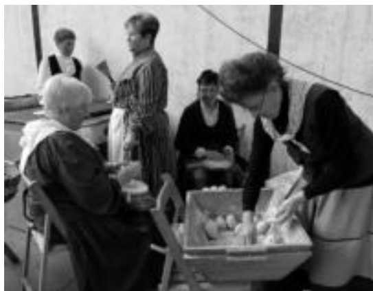
Aurten ere taloak jateko aukera eskainiko dute.