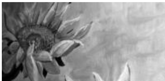
Herriko haurrak izan ziren erakusketa ikusten lehenak; bigarren irudian, eguzki loreen koadroa ikusi daiteke. A. IMAZ