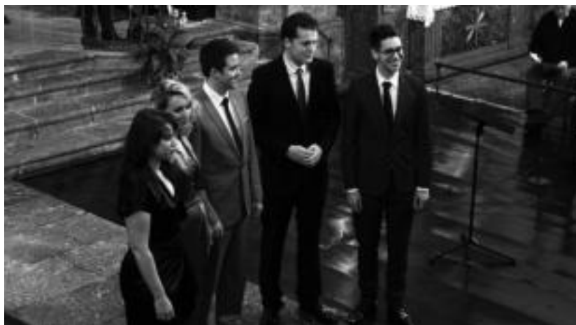
Apollo 5 britainiarrak musika sakratuan aritu ziren goizean. I. URKIZU

Horrela beraz, Europako aho-tsez osaturiko bi talde soilik igo ziren eszenatokira. Irlandako New Dublin Voices abesbatza sarritua izan zen lehena, eta Lorenzo Ondarraren Pater Noster obra