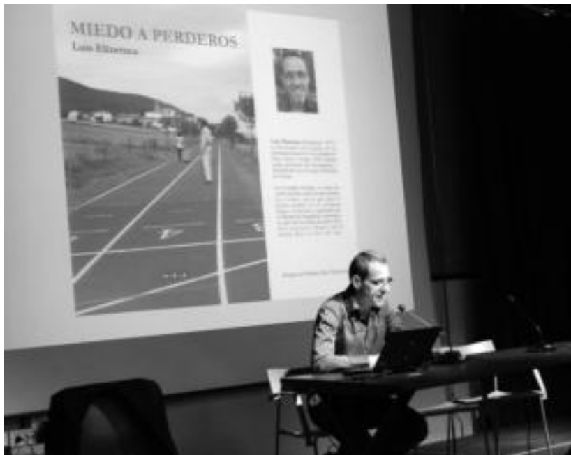
Elizetxearen ikasle, ikasle ohi nahiz lankideak bertaratu ziren kultur etxeko aurkezpena.

Aurkezpen berezia egin zuen irakasleak, eskerrak ematen hasita: «Ez nuen pentsatuko sei urte beranduago beste liburu bat aurkeztu ariko nintzenik». Horrela, eta anzterki munduan duen esperientzia probestuz, Eduardo Mendoza, Carlos Ruiz Zafón, Arturo Pérez Reverte nahiz Javier Mariásen izenak aipatu zituen, bere idazle kutitun gisa. Idazle moduan haiek bezain entzutetsua ez den arren, esmokina eta betaurrekoak jantzita aurkeztu zuen liburu-