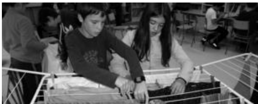
Anoeta eta Irurako ikastoletako ikasleak parekidetasun praktikak egiten.