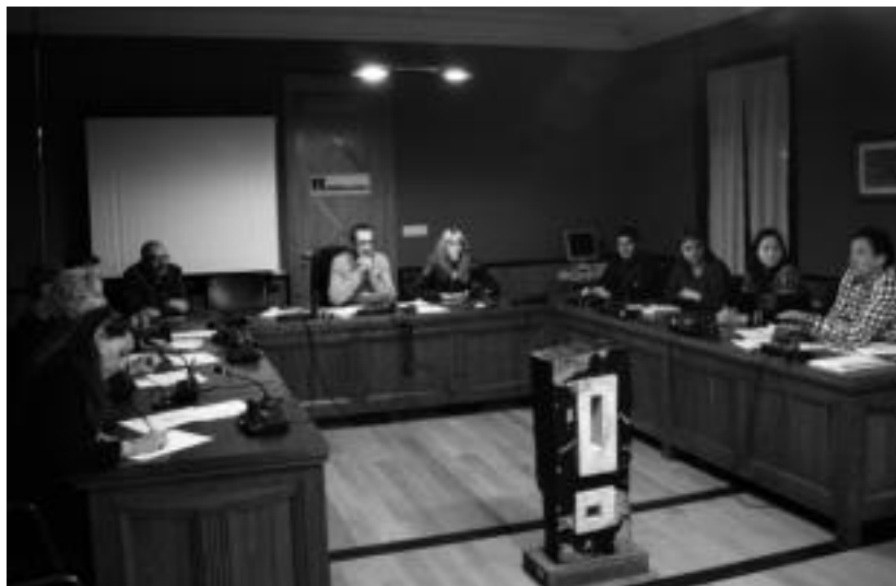
Herenegun eginiko ezohiko bilkuran onartu zituzten datorren urteko udal zergak eta tasak. I. TERRADILLOS

Kasu horiek, beraz, ez dira etxebizitza huts moduan izendatuak izango, eta ohiko zerga ordaindu beharko dute. Gainerako etxebizitzek, berriz, %50eko errenergua