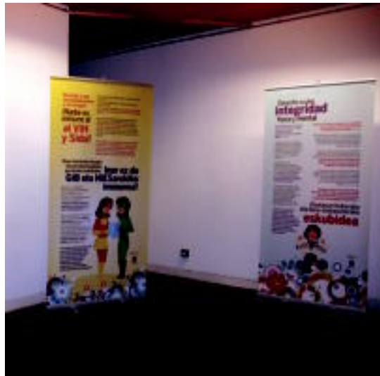
Aranburun informazio asko eskuratuta daiteke, erakusketari esker. E. MAIZ

Hamaika panelen bitartez, sexu eta ugalketa eskubideak zer diren azaltzen ahalegintzen da erakusketa, eta horietako batzuetara gerturatu egiten da: bortizkeriarik gabeko bizitza izateko eskubidea; segurtasun fisiko eta mentalaren eskubidea; sexual-