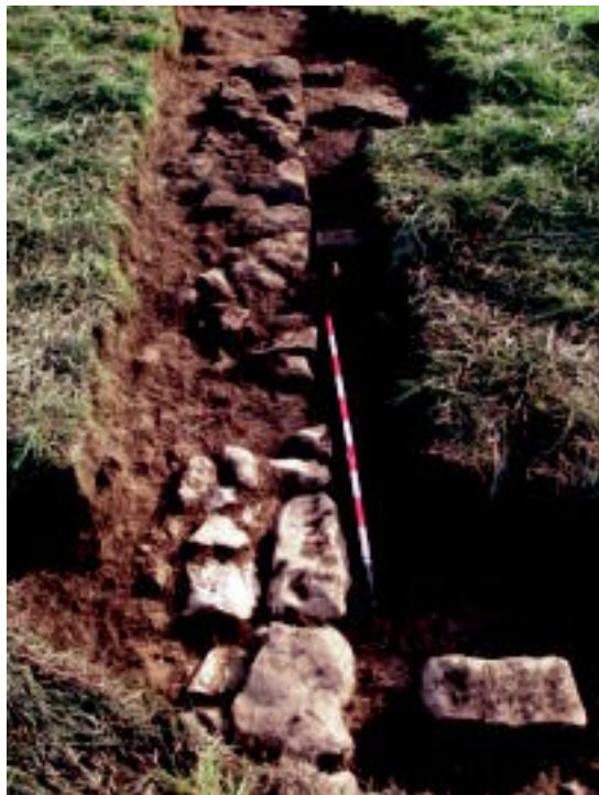
San Pedroburun aurkitutako horma ziur aski eliza batena da. HITZA

Etxezarragak abian jarri zuen ikerketa bat, ermitak dauden edo izan diren lekuak aztertzeko. Orain bi urte hasi zen miaketa kanpainarekin Azpeitia inguruan, eta iaz hasi zen Errezil, Bidegoian eta Albiztur inguruan. «Iaz konturatu ginen, oraindik