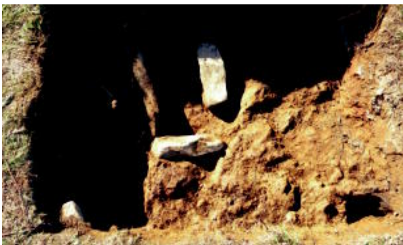
San Pedroburu eremua (goian) eta bertan aurkitutako X. mende inguruko haur baten hilobia.