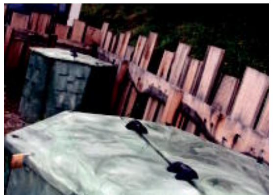
Konpostagailu komunitarioa zer den ikusteko aukera dute herritarrek. A. I.