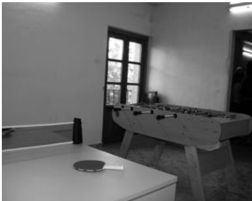
Gaztelekuaren beheko solairuan, besteak beste, mahai tenisa eta mahai futbola dituzte. E.MAIZ

tik txikitatik egon behar du aurrera horrek», gaineratu du. Nerabeei ere eskerrak eman dizkie Mantxolak: «Beraiek egindako lanagatik eman dugu prozesu guztia aurrera».