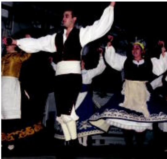
Valladolideko Folklore La Rotonda taldea izan zen, iaz Tolosan. M.U.

Bertako dantza taldearekin igaro zituzten egun batzuk, eta asteburu honetan, elkartrukearen bigarren zatia betetze aldera, Valladolideko dantzarien bisita jasoko dute. Larunbatetik igandera bitarte izango dira Tolosan, eta dantza egiteaz gain, «gure herriaren, gastronomiaren eta ohituren zertzelada partek ematen saiatuko gara».