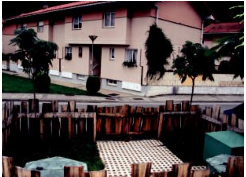
Lizartzan bi gune jarri dituzte konpostagailu komunitarioentzat. Irudian, frontoiaren ondoan dagoena. A. IMAZ

Mankomunitateko kidearen esanetan, «konpostagailu komunitarioak eta norbanakoak jartzeko aukera egongo da herri guztietan», eta hori erabakitzea herritarren esku egongo da. Une honetan, Orendainen formakuntza ematen ari dira, eta hilabete hasierarako dena prest eduki nahi dute: «Ondoren, Orea hasiko gara, eta bi asteren bueltan, Orendainen bezala, konpostagailu guztiak martxan jarriko dira.