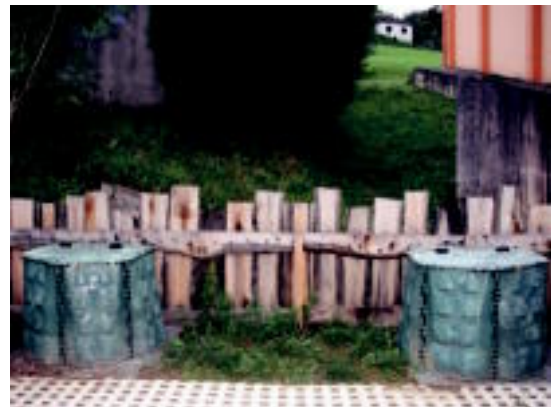
Lizartzako bi gunetan konpostagailu komunitarioak jarri dituzte. A. MAZ

Hondakin organikoaren %100 herrian bertan birziklatu nahi dute hainbat herri txikitan; konpostagailu komunitarioak eta norbanakoei egokituak jarriko dituzte o4