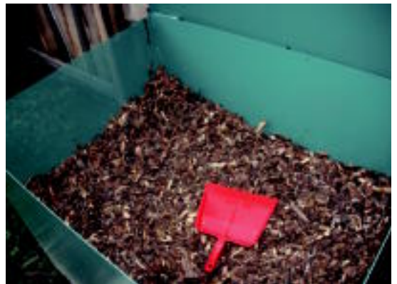
Hosto lehorek ere euren txokoa dute Lizartzako konpostaje gunean.

Hamabi herriren plangintza izan arren, eskualdeko herritar guztiak eman ditzakete urratsak, Maiozen esanetan: «Hauek egiten ari dira, baina edozeinek eska dezake konpostagailua. Norbanako kasuan, udaletxera edo mankomunitatera joan daiteke, eta komunitarioetan, udaletxearekin hitz egin behar da. Udaletxea noiz etorriko zain egon beharrenean, laguntza handia litzateke proposamenak aurkeztea».