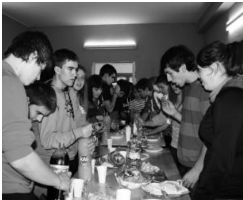
Gaztelekuaren inaugurazioa egin zuten orain bi aste. E.MAIZ

Bost saio inguru egin ziren eta parte hartzea zabala izan zela dio Mantxolak. «Parte hartzea ikaskuntza prozesu bat da, horrega-