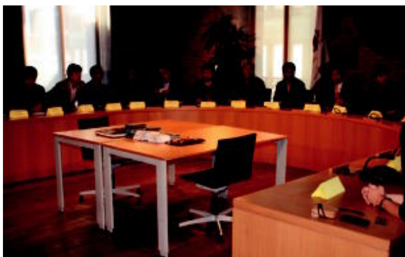
Tolosako udal ordezkariak egin zieten harrera udaletxean.