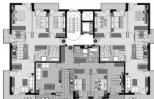
Solairu bakoitzean egongo diren hiru etxebizitzaren planoak. HITZA

Izena emateko zerrenda interesatuta duten guztiarentzat irekita dago, hau da, herrikoek gain, beste udalerrietakoek ere izena eman dezakete. Horretarako Altzoko udaletxera joan edo 943 65 24 13 telefono zenbakira deitu daiteke. Derrigorrezko baldintza izena emateko etxebizitzarik ez izatea da. «Gure asmoa urtea bukatu baino lehen hau guztia lotuta izate