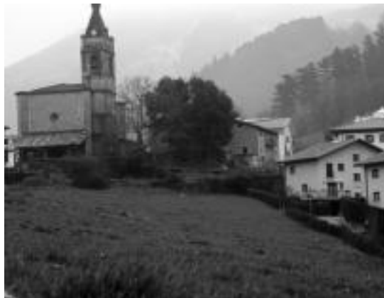
Etxebizitzak egiteko asmoa duten eremua. E. MAIZ

Etxebizitzaren ezaugarriak zehaztuta daude: hiru logela izango dituzte, sukaldea, egongela, bi bainugela eta terraza. Guztira erabilgarri 80 metro karratu izango dituzte. Behe solairuan garaje itxiak izango dira, eta bakoitzak 36 metro karratu erabilgarri izango ditu. Prezioa zehaztuta dago: 186.000 euro gehi BEZa izango da. Etxebizitzi buruzko informazio gehiago jasotzeko, fatxadaren itxura eta erabiliko diren materialak esaterako, udaletxera joan daiteke.