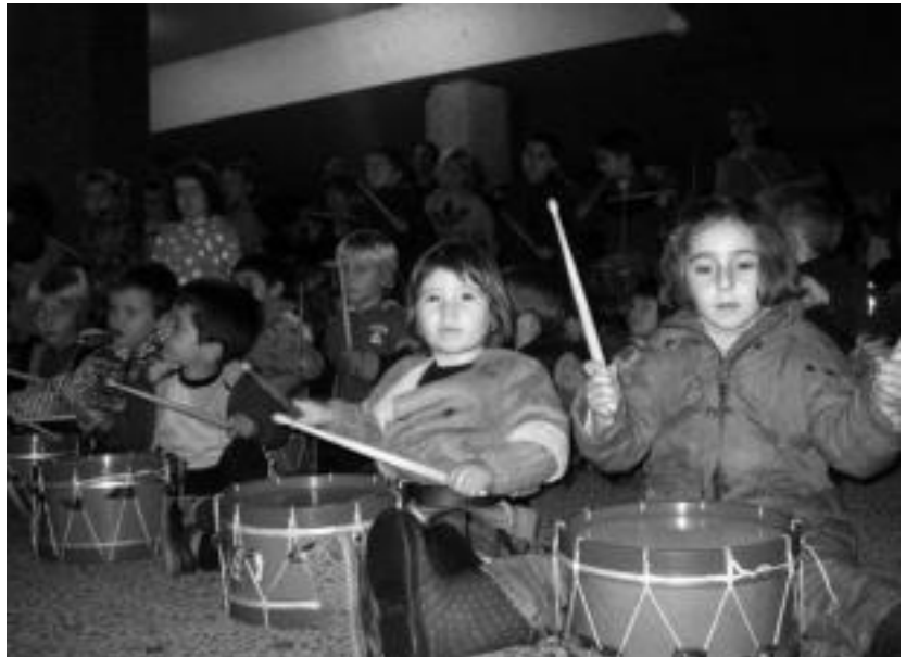
Pasa den ostiralean egin zuten lehen entsegua, auzoan bertan. HITZA