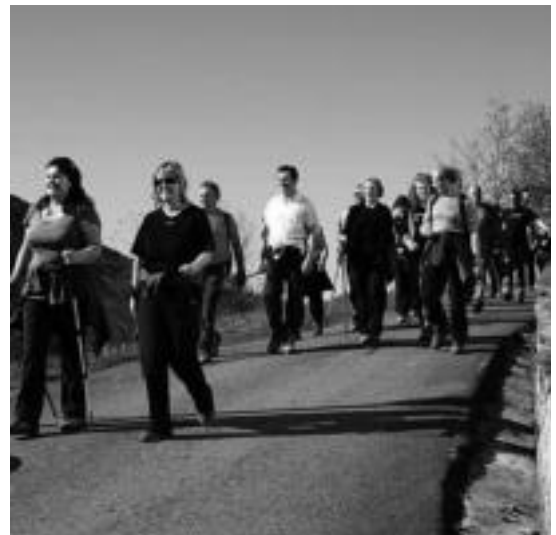
Urtero bezala, Uitzitik Oresarako ibilaldia egingo dute. HITZA

■ Ganbaran. Kultur hamabostaldiak irauten duen bitartean Mundu batetik argazki erakusketa egongo da ikusgai udaletxeko ganbaran.