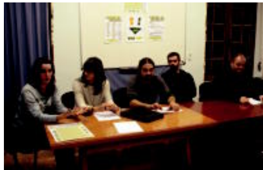
Larramendi jai batzordeko zenbait kide, aurkezpenean.

Bestalde, RAID lasterketa antolatu da hilaren 27an eta horretarako izena ematea eskatzen da 23a baino lehen, nahiz eta egunean bertan ere egin ahalko den. Sei