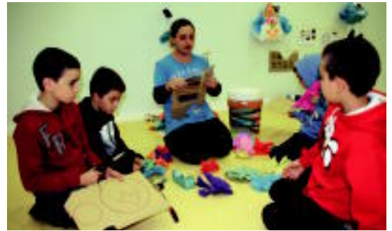
Azkue auzoko haurrak apaingarriak egiten aritu dira. R. CALVO

pelketa egingo dituzte. Afariaren ondoren, Ugane bertako musikariek osatutako Santuipeko taldearen emanaldia izango da.