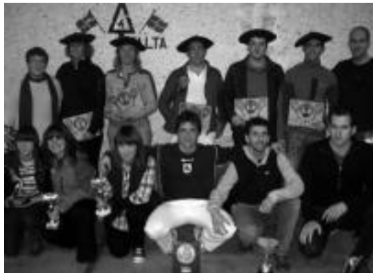
Pasa den urteko frontenis txapelketako irabazleak. HITZA

Frontenis txapelketan parte hartu nahi duenak dagoeneko izena emateko aukera izango du.