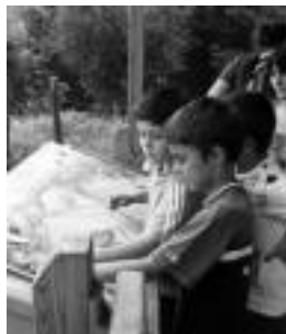
Panelekin egingo dute jolas. HITZA

Larraitzetik Abaltzisketara doan ibilbide irisgarrian ibilaldi gidatu motza egingo dute, eta amaieran jolas batean parte hartzeko aukera izango da. Taldeka, bidean dauden panelak erabiliz, froga eta asmakizun ezberdinak osatu beharko dituzte.