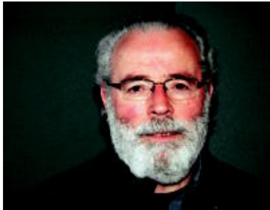
laz Lazkao Txiki hizpide izan zuen Amurizak, Lizardi elkartearekin. HITZA

21:00etan hasiko da Lizardiko afaria, eta ordu eta erdi inguru iraungo duen saioan, bat-bateko aleak entzun ahal izango dituzte bertaratuek ondoren: «Bat-bateko bertsoen aukeraketa egin dut,