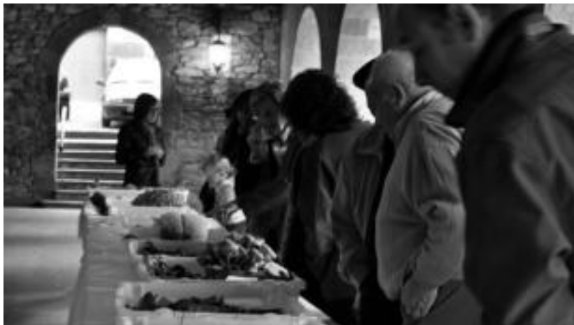
Karrapean jarriko dituzte sailkatuta datorren astean bilduko dituzten perretxikoak. SARA GOMEZ

Mikologialdiko azken egunean hamaika ekintza egingo dituzte. Tailerrak eta erakusketekin batera, XIXekin eginiko pintxoak dastatu ahalgo dira.