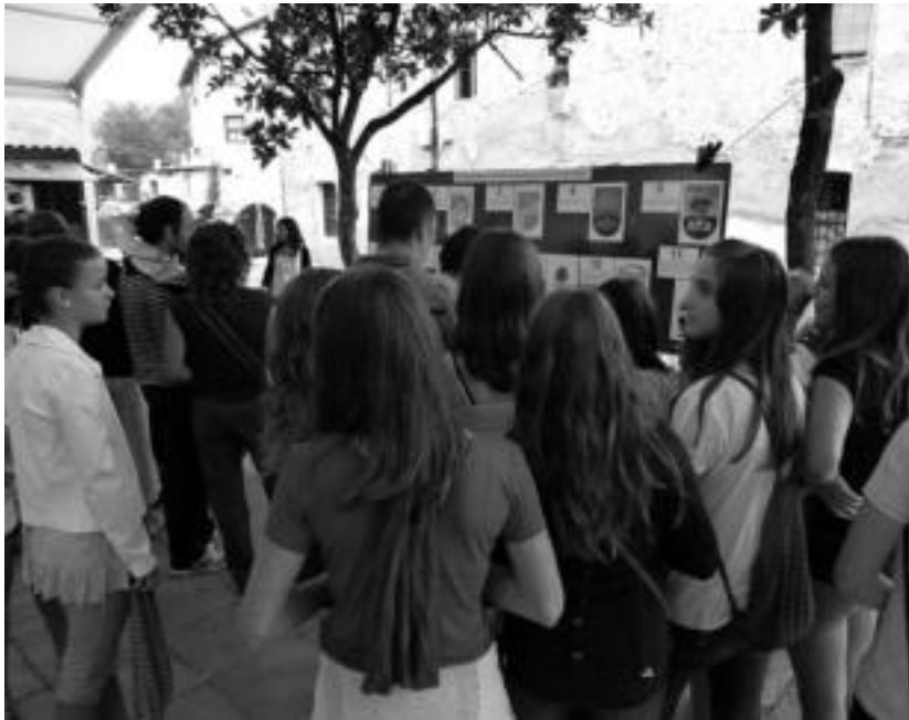
Zizurkilgo jaietan herritarrek armarrri berriaren inguruko ekarpenak egiteko aukera izan zuten.