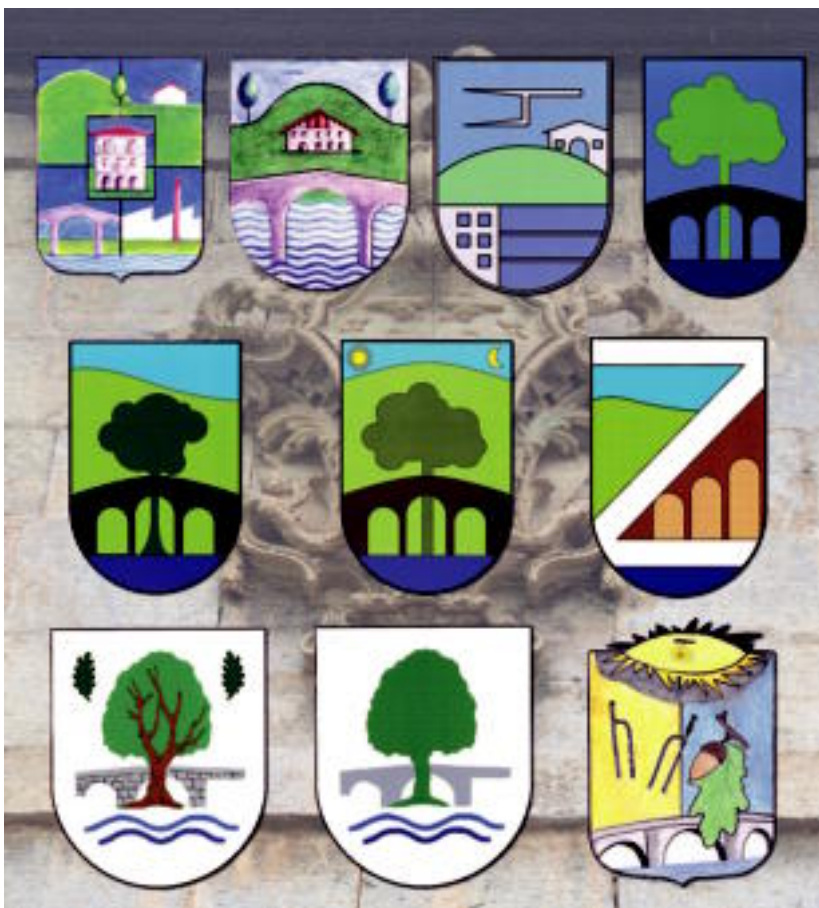
Zizurkilgo armarri berriak goian ikusi daitezkeen lanetako hainbat elementu izan ditzake.