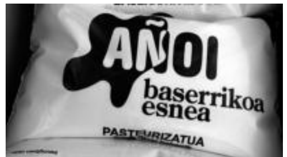
Plastikozko edukiontzian banatzen dira; litro bat esne. A. IMAZ

kietarako adibidez, gogorregia suertatu daitekeela». Produktuaren gakoa, hemen kokatzen du Errazkin, fideltasunean: «Ohitzen denak ez du aldatu nahi izaten, gustura edaten du, ondorioz, jendea horixe eskatuko nioke, probatzea». Litroaren prezioa 1,10 eurokoa da: «Dendan erosi edo etxean jaso, prezio berdina da». Esne banatzailearekin kontaktuan jartzeko, 645 72 38 77 telefono zenbakira deitu, edo ainoia-kobanaketa@gmail.com helbidera idatzi behar da.