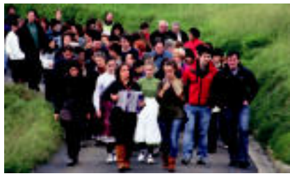
Baserritar emakumeak omentzen dituen eskulturara kalejarian igo ziren. 1. irudia