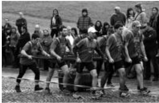
Berrobi taldekoak ahalegin betean. JONE AMONARRIZ

Mendia oso pozik agertu da lorpenarekin: «Urte osoko plangintza egin dugu. Uztailean jokatu genuen kanporaketa eta ordudunik ere oso serio aritu gara. Hain justu, herri kirolean hori falta da askotan, plangintza bat izatea. Guk lanak ondo egin ditugu eta horren emaitza da ere txapela lortzea». Berrobik 81 plaza, 8 zinta eta 2,35 metro egin zituen 15 minutuko bi saioetan. Urretxu oso gertu geratu zen, 81 plaza, 4 zinta eta 0,63 metro eginez. Orio izan zen hirugarrena, 79 plaza, 3 zinta eta 2,82 metroko distantziarekin.