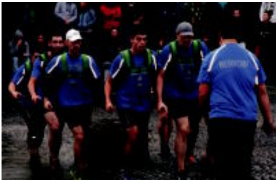
Espero ez bazuten ere, berrobitarrek izan ziren garaile. J. AMONARRIZ

81 plaza, 8 zinta eta 2,35 metro egin dituzte berrobitarrek txapela lortzeko; eskualdeko beste taldea, Aiztondo, laugarren sailkatu da 07