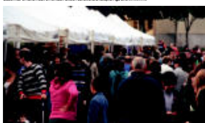
Jende asko igo zen Zizurkil Goko azoka berezira; 50 postutik gora jarri zituzten. 1. irudia