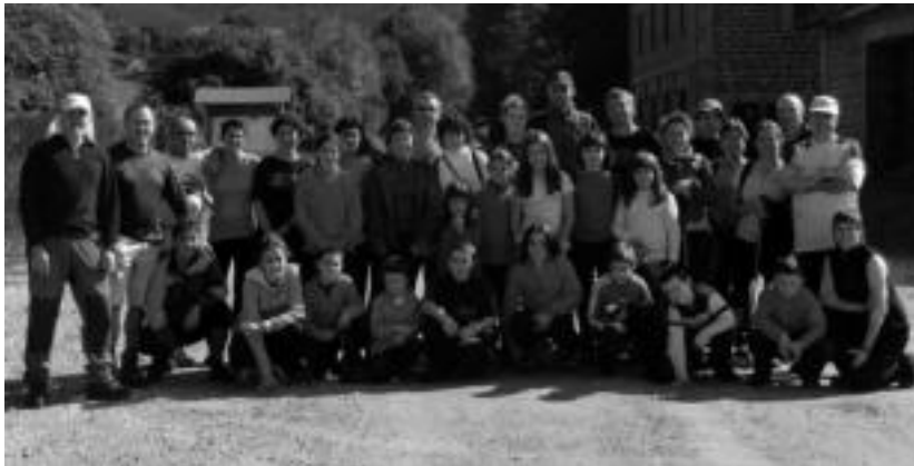
Uitzitik Leitzarako bidea egin zuten San Esteban auzoko hainbat gaztetxok eta helduk. HITZA