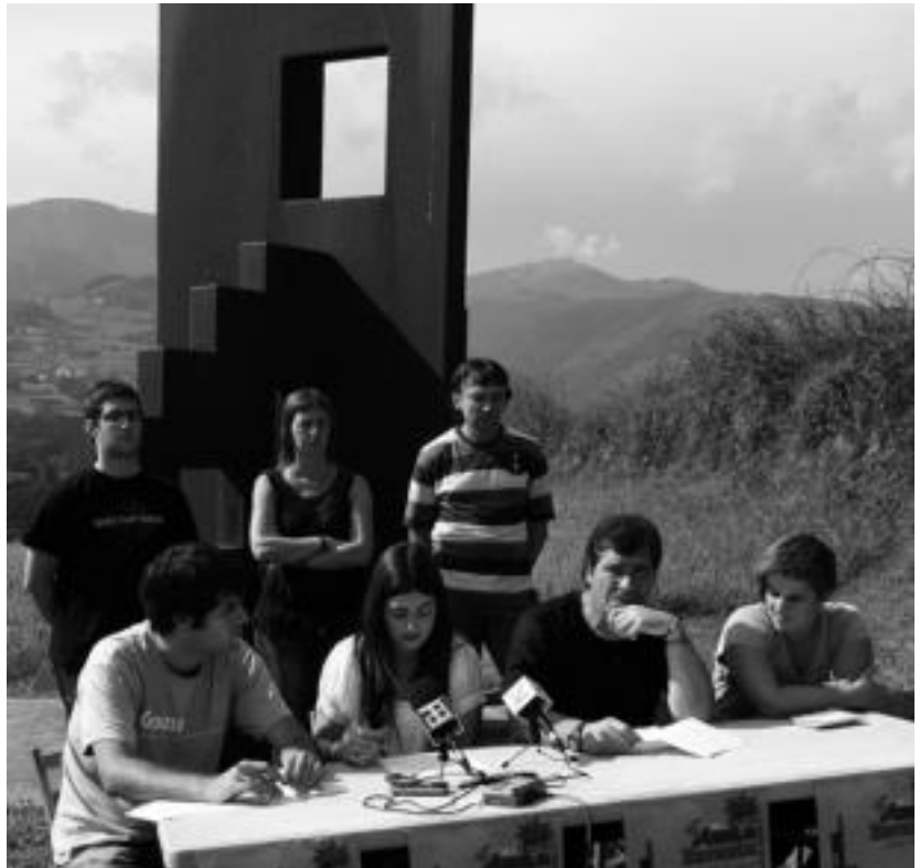
XV. Azoka Berezia Baserriko Argia eskulturaren ondoan aurkeztu zuten Zizurkilen, asteazkenean. A. IMAZ

Baserriko Argia udalaren eta EBEL Emakume Baserritarren Elkarteen artean jarri zuten 2002an. Igandeko ekitaldiarekin garai hartako aitortpena berretsi nahi da, bi eragileen arteko harremanak berreskuratuz.