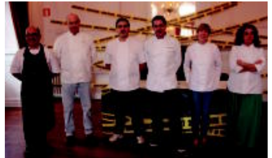
Mikologia Jardunaldietan parte hartuko duten sukaldariak. LURKIZU

Datorren asteazkenean hasi eta larunbatean bukatuko da Tolosako elkarteak antolatutako astea; elkarteen arteko sukaldaritza lehiaketa mikologikoa ere egingo dute aurten o4