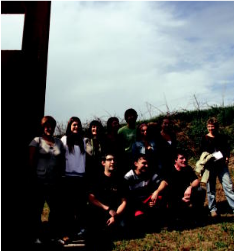
Baserriko Argia eskulturaren gerizpean aurkeztu zuten Zizurkilgo XV. Azoka Berezia. A. IMAZ

Ostirala, 2012ko urriaren 12a. IX. urtea. 2.415. zenbakia. tolosaldea.hitza.info