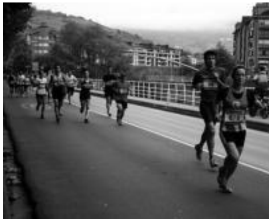
lazko Tolosako Herri Krosan, korrikalariak Araba etorbidean. E.MAIZ

Iaz 360 korrikalari inguruk parte hartu zuten. Parte hartze handia izan ohi du herri krosak, laster izango den Behobia-Donostia probarako prestatzeko erabili ohi dutelako korrikalariak. Antolakuntzak dioenez, urte guzti hauean probaren iraupena auzokideen, Tolosako Udalaren eta babesleen laguntzak bermatu ditu.