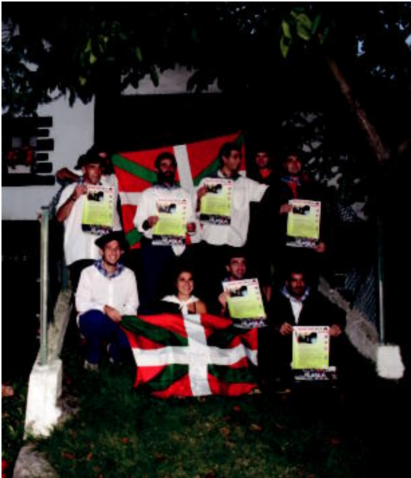
Artzain-andrez jantzita aurkeztu dute jai eguna, Arozetxe baserriaren aurrean.

Asteazkena, 2012ko urriaren 10a. IX. urtea. 2.413. zenbakia. tolosaldea.hitza.info