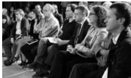
Urkulluz gain, EAJko hainbat kide izan ziren Tolosako ekitaldian. I. U.

Amaitzeko, alderdi guztien arteko akordio baten beharra azaldu zuen, «giza eskubideak, biktima guztien aitortza, iraganarekiko memoria kritiko eta etikoa, nahiz alde guztien arteko elkarrikeria moduko printzipioekin».