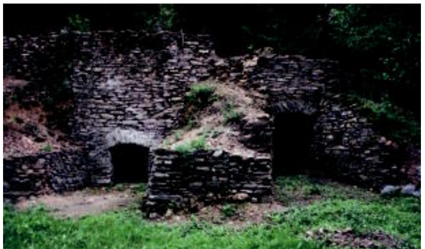
Goian, karobia garbitu gabe zegoenean, eta behean, aste batzuen buruan, zaharberritu eta gero. I.T.