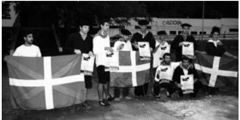
Arozetxe baserriaren aurrean aurkeztu zuten Euskal Jaia 2012, atzo, artzain-andrez jantzita. A. IMAZ

Aurtengo festa larunbatean hasiko da, sega ikastaro batekin. Arozetxe baserriaren ondoan da- goen zelaian, etorkizuneko sega- lariak herri kirol eder honetaz go- zatzeko aukera izango dute, sega munduan lehen urratsak emana- z. Gazte zein heldu, herritar guztiak gonbidatu dituzte antola- tzaileek, hau da, udalaren babes- arekin lanean aritu diren herrita- rrek. Iluntzean, biharamuneko egun handia prestatzen hasiko dira, txekorra errez. Igandean, hi- laren 14an, Euskal Jaia 09:30ean