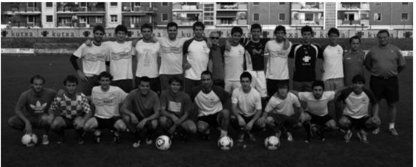
Tolosa CFren talde nagusiko jokariak eta prestatzaileak, Berazubiko zelaietan, entrenamendu bat hasi aurretik. I.G.L.