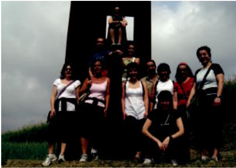
Villabonako eta Zizurkilgo AEKko hainbat ikasle. HITZA