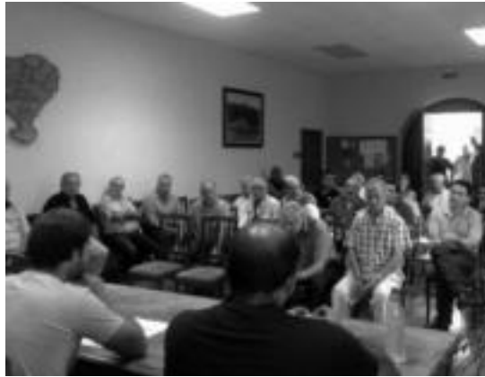
Pasa den larunbatean egin zuten bigarren enkantea udaletxean. HITZA

Ondoioz, espero baino «kaxkarragoa» izan da aurtengo uso postuen enkantea. Pasa den urtean bezala, Urteaga mendian kokaturiko 27 postu atera ziren enkantera. Horiak, kokapenaren eta bakoitzaren ezaugarrien arabera, hiru multzotan banatu zituzten. Hala, 150, 300 eta 600 euroan zehaztu zituzten postuen hasierako prezioak.