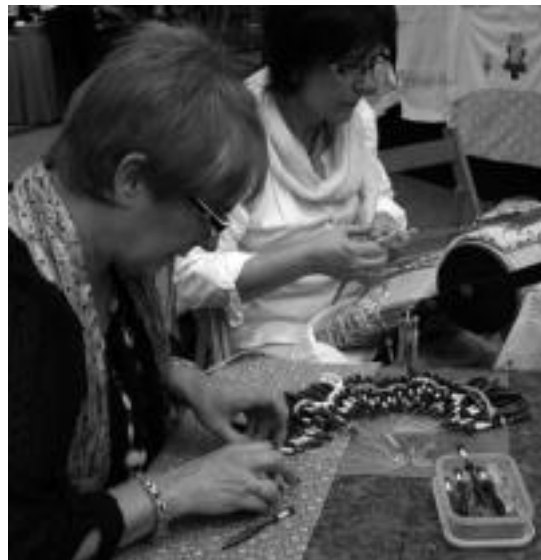
Urtero errepikatzen den lantegietako bat ehoziriarena da. HITZA

Urrian hasi eta maiatzean amaituko dira lantegiak. Sabel dantza ostegunetan izango da, 18:00etatik 20:00etara eta 20:00etatik 22:00etara; egur taila, berriz, asteartean emango dute, 18:00etatik 21:00etara; ehiztari tailerra ere asteartean izango da, 15:30etik 17:30era eta 17:30etik