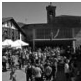
lazko azokako une bat. HITZA

Ostirala, larunbata eta igandea izango dira egun nagusiak. Ostiralean euskal presoak izango dituzte gogoan. Egun horretan, hala-