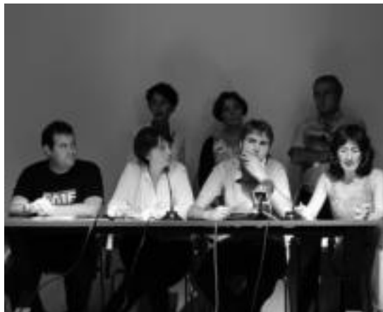
Egitasmoa ikastetxeekin elkarlanean egin dute. I. URKIZU

Horrela beraz, Tolosako gazte-ak etorkizuna direla azalduz, ikas-