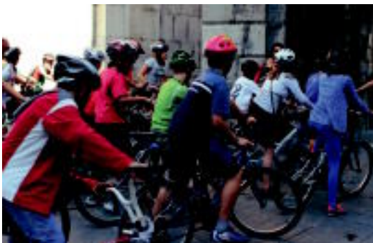
Ikasleek proposamenak egiteko aukera ere izan zuten, besteak beste... u.

Tolosaldeko Bizikleta Plana aurkeztu berri dute Tolosan; ingurumenaren eta osasunaren aldeko apustua dela dio Irazusta egileak ◦2