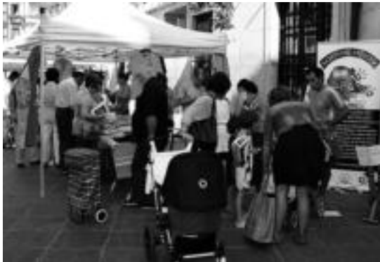
Tolosan iaz egin zuten bigarren eskuko merkatu txikiaren lehen edizioa. A.I.

tako diru guztia, Etiopiara bidaliko dute Abay-ekok, Walmarta herrixkara. GKEtik azaldu dutenez, bertan «proiektu eder bat» ematen ari dira aurrera: «Bertako haurrek ikastolara joateko aukerarik ez zuten, ur bila bidaltzen baizituzten. Putzua herritik 10 ki-