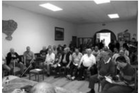
Pasa den urteko ehiza postuen enkantearen une bat.

Pasa den urtean bezala, Urteaga mendian kokaturiko 27 ehiza postu jarriko dituzte enkantean. Adituek diotenez, «ehizan aritzeko