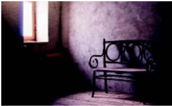
Aranburu jauregian ikusgai dauden 40 argazkiak epaimahaiak sailkatu ditu.

Ikusgai dauden 40 argazkietatik, 11 izango dira irabazleek hila bete bakotzak argazki bana izango du, eta lehiaketako irabazleek datorren urteko egutegiaren azala beteko du. Modu honetara, saritutako sei urte bezos gasa doan