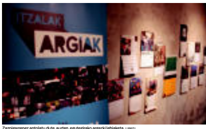
Zazpigarrenez antolatu dute, aurtan, egutegiako argazki lehiaketa.