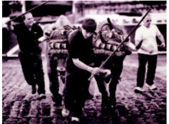
Aranburu jauregian ikusi daitekeen argazkietako bat.

Aldundiak aurreproiektua argitaratu emango du hil honen bukaeran eta ekarpenak egin ahal izango dira; zerbitzuaren berrantolaketa egin duten erakundeek «herritarren beharretara» moldatu dutela diote 03