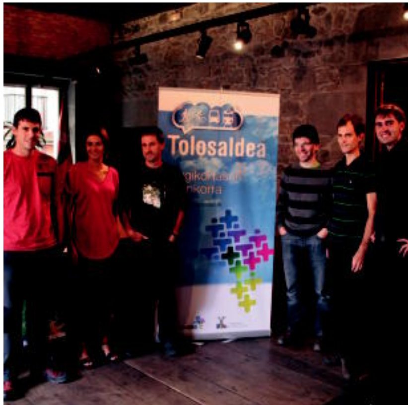
Tolosaldea Garatzeneko, aldundiko eta eskualdeko udalen ordezkariek, atzo, Tolosako udaletxean. I. GARCIA LANDA

Tolosa Gasaren eta Tolargiren datorren urteko egutegiko lehiaketarako aukeratutako lanak ikusi daitezke Aranburun, urriaren 6a arte 04-5