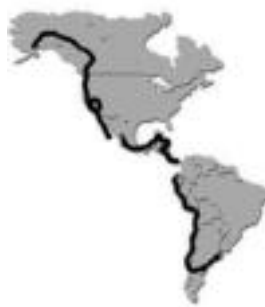
Alaskatik Argentinara. HITZA

Trabak gutxitu eta laguntza gehitu egin behar dela. Adibide bat jarzteagatik, Ameriketako Estatu Batuetan edo Kanadan, autobusek parrilak zituzten. Sistema oso erraza da, eta ez du kostu handirik.