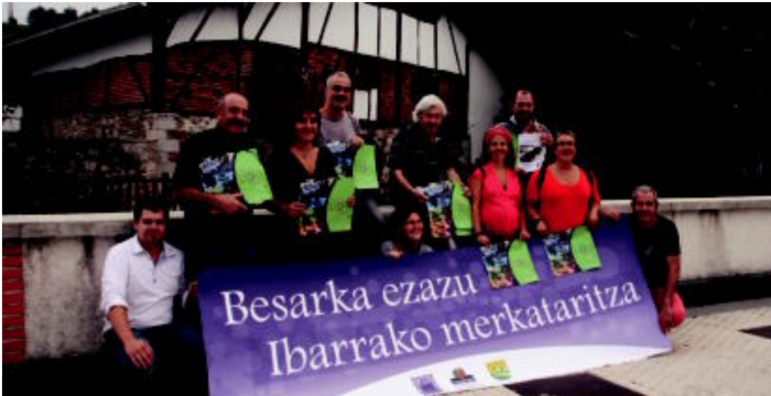
Hauspoako, merkatarien elkarteko, Xeplako, udaleko, baserrietako eta postuetako hainbat ordezkari aurkeztu zuten azoka berezia. I.TERRADILLOS

Asteazkena, 2012ko irailaren 19a. IX. urtea. 2.402. zenbakia. tolosaldea.hitza.info