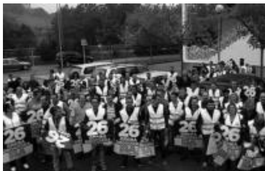
ELAko ordezkariek elkarretaratzea egin zuten.