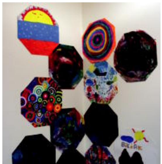
Goian, kareta edo kataloak, eta behean margotuz egindako irudiak. ir.

tetxoak oso pozik egon dira eta asko gozatu dute».