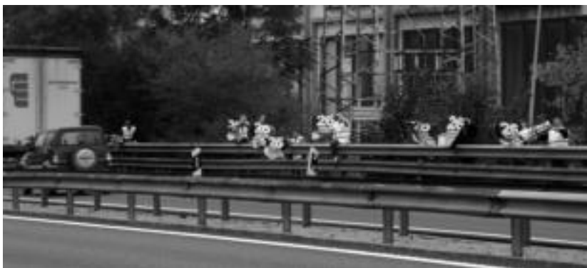
ELAko ordezkariek, atzo, N-1 errepidearen alde batean, greba orokorrerako deialdia egiten. I.G.L.