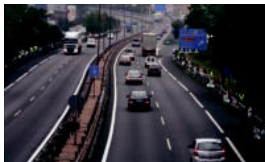
N-1 errepidearen ertzean elkartu dira 120 ordezkariak. I.G.L.

Tolosaldeko eta Goierriko sindikatuko 120 ordezkari elkartu dira N-1 errepideko Irura eta Villabona arteko zatian protesta egiteko 03