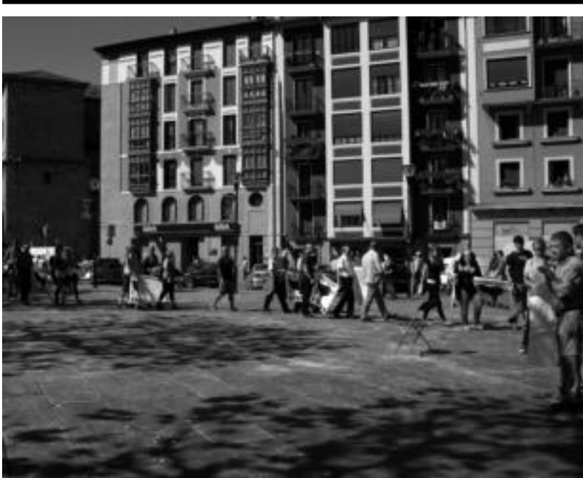
Bizi osorako kartzela zigorraren amaiera eskatu zuten Tolosan larunbatean, giza kate batekin. E. MAIZ