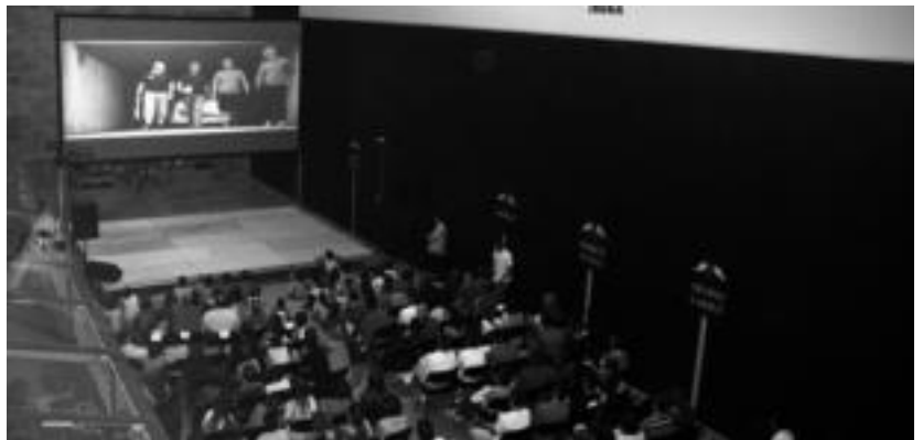
Goian, dantzarien saioa inaugurazio ekitaldian; behean, trinketea beteta xareari buruzko bideoa ikusten. A. IMAZ