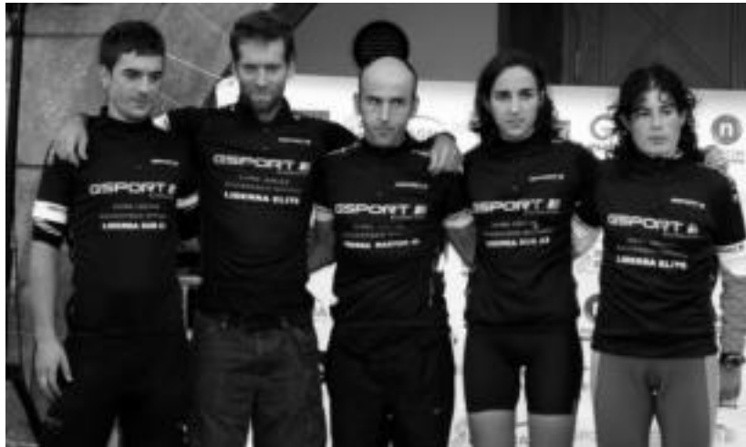
Pasa den urteko Ibarriko Mendi Duatloiko irabazleak. HITZA

Bestalde, Internet bidez egin ahaliko dute izen ematea parte hartu nahi dutenek, www.mendi-