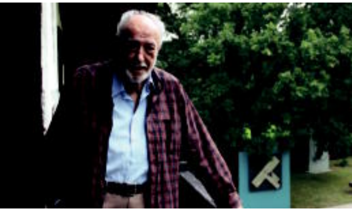
Nestor Basterretxea • Artista

88 urteak beteta, iraganeko zenbait gauza ez gogoratzeak ez du izutzen Nestor Basterretxea. Gaurkoari eta biharkoari begira bizi da artista Hondarribian, bokazio duen artea albo batera utzi ezinik.