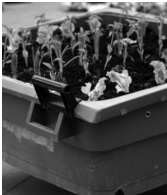
Hiri baratzeen proiektuko edukiontzi bat. JOSEBA MERCADER

Aurrera begira, hil honen bukaeran erakusketa bat jarriko