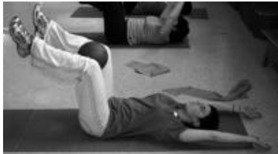
Besteak beste, pilates egiteko aukera izango da. A. IMAZ

Multifitnesen kasuan, eskolak astearte eta ostegunetan 11:00etan eta 18:30ean izango dira, aldiz, astelehen eta asteazkenetan 19:00etan izango da. Bazkideek 66,04 euro eta bazkide ez direnek 90,98 euro ordaindu beharko dute. Yoga, astelehen eta asteazkenetan 11:00etan, eta astearte eta ostegunetan 15:15ean eskainiko dute. Hiruhilabeteko kostua