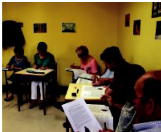
Idatzitako irakurtzen dute ikasleek, ondoren ulermena lantzeko. R. CALVO

Ikasle eta irakaslearekin bilduta, argi ikusten da giro ona dutela denen artean; asko hitz egiten dute, ez dute iritzia emateko inongo arazorik, eta hori ere antzematen da beren lanetan. «Eztabaida asko izaten ditugu; egunkariko albisteetan inguruan hitz egiten dugu beti eskolak hasi baino lehen, eta horrela ere ikasten da,