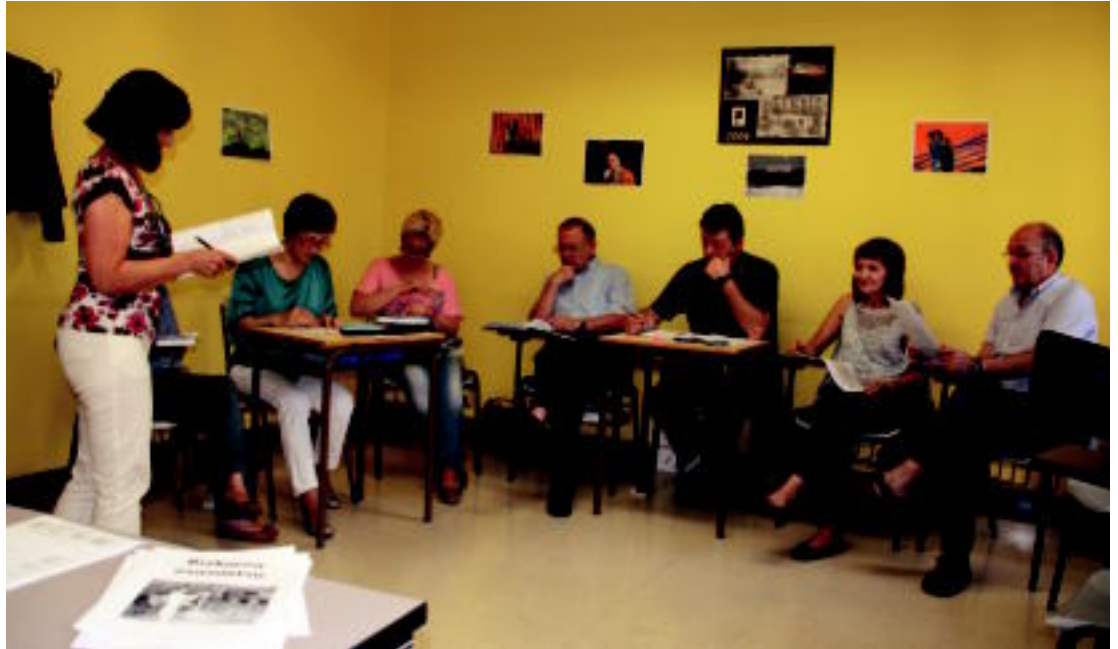
Ikasturteko azken eskolan ere lan eta lan aritu ziren ikasleak eta Otaegi irakaslea. R. CALVO

Euskara eta komunikabideak Alfabetatze eskolak apiriletik ekainera bitartekoak dira, bi urte dira, eta astean hirutan elkartzen