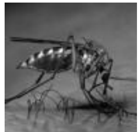
Culex pipiens eltxoa.

Konturatuko zinetenez, berririo bueltan da, gure ekokulturaren txoko xume hau. Aurten ere izango dugu zer kontatua, baina proposamenak ez dira soberan izango, beraz, idatzi lasai eta proposatu, zuek baitzarete zutabe honi zentzua ematen diozuenak: bioaniztasunetik@hotmail.com .