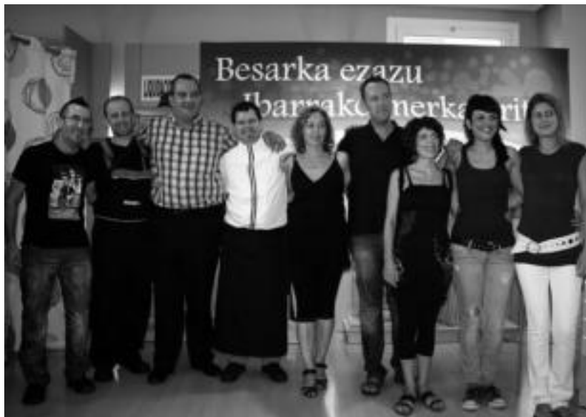
Merkatari taldeko hainbat kide, atzo, kanpainaren aurkezpenean.

Gune horretan egingo dute, halaber, sarien zozketa. Irailaren 12tik 22ra Ibarrako Merkatarien elkarteak bazkide diren dendetan egiten diren erosketengatik, eta «merkataria besarkatu ondoren», bezeroak jasotzen duen erosketa txartelaren atzealdean bere izen abizenak idatzi ditzake eta denda bakoitzean egongo den kaxan utzi. Irailaren 22ko eguerdian erosketa txartel guztiak jasoko dituzte, eta hurrengo egunean, hau da, azoka egunean erabiliko dituzte zozketa egiteko. 11:00etatik aurrera hasiko dira zozketa egiten. «Zenbait minuturo txartel bat aterako dugu, eta