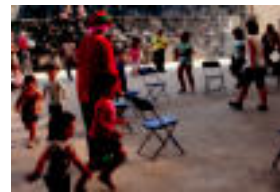
Tolosako Bedaio auzoan haurrek jolasen aukera izan zuten, besteak beste, aukien jolasarekin...