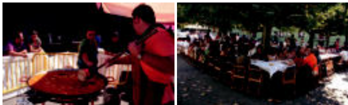
Elduainen herriarekin prestatu zuten herri bazkarian jan zuten paella...