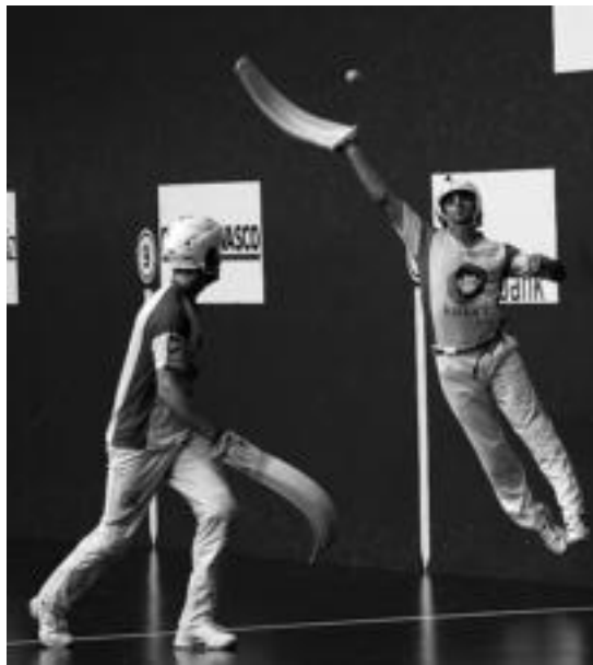
Zeberio eraso bati erantzuna ematen, larunbatean, Galarretan. MAIALEEN ANDRES

Urrizak alde egitea lortu zuen berriro, eta Zeberio gerturatu egin zitzaion, 22 eta 23 aurretik jarri arte. Elduaindarrak ez zuen lortuko berriro ere aurretik jartzea, baina, hori bai, puntu bakarrera izan zuen aurkaria. 29-28 egon zen markagailua partidaren azken txanpan. Beraz, batera edo bestera egin zezakeen partidak. Azkenean, iruindarrak egin zuen azken tantoa, 30-28koa. Batak zein besteak final handia egin