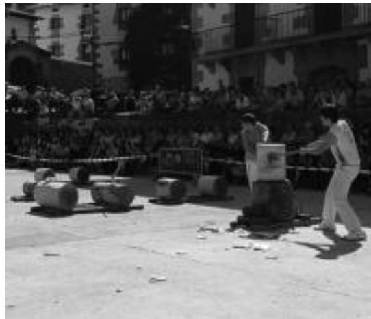
Leitzako txinga txapelketaren ostean, aizkora erakustaldia egin zuten. HITZA

Orain buru-belarri jarriko da binakako txapelketa prestatzen. Urriaren amaiera aldera ekin dio, eta iaz irabazitako txapela defendatzea izango da bere egitekoa. Oraindik, baina, ez daki norekin batera ariko den lehian: «Enprekak osatzen ditu bikoteak, eta oreka mantentzea bilatu ohi dute; nire kasuan, edozein pilotaririk oso gustura jokatuko dut».