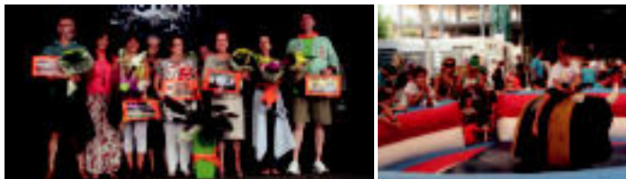
Zuzurkigo jaietan, balkoietak lore apainketa lehiaketako hairbat parte hartzaile, eta haur bat Jose Arregi plazan jarri zituzten jokoetako batean...