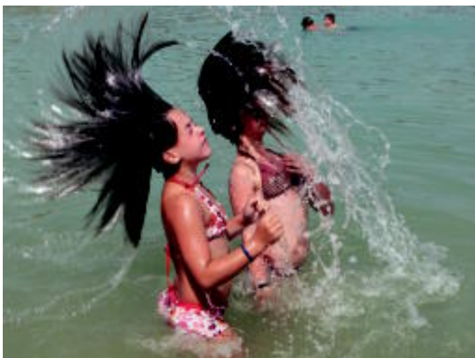
Allotz urtegiari ateratako argazkia. AGURTZANE ALKAIAGA