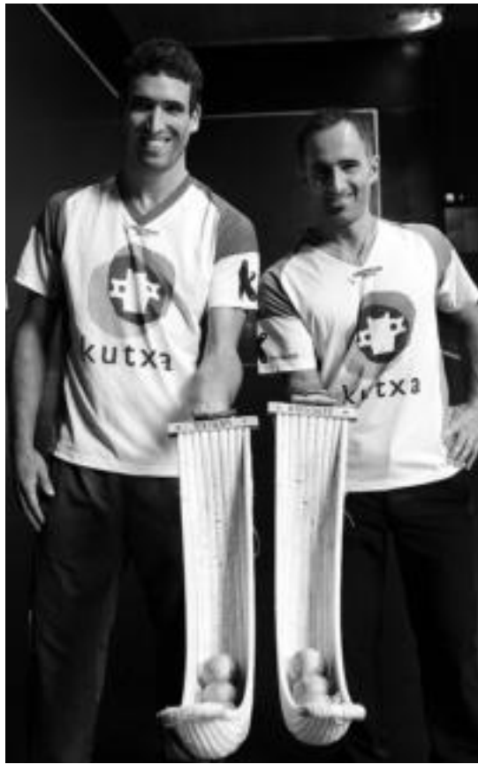
Urriza eta Zeberio finalerako aukeraturako materialarekin. MAIALEN ANDRES