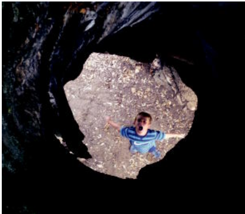
Mendazan ateratako argazkia.