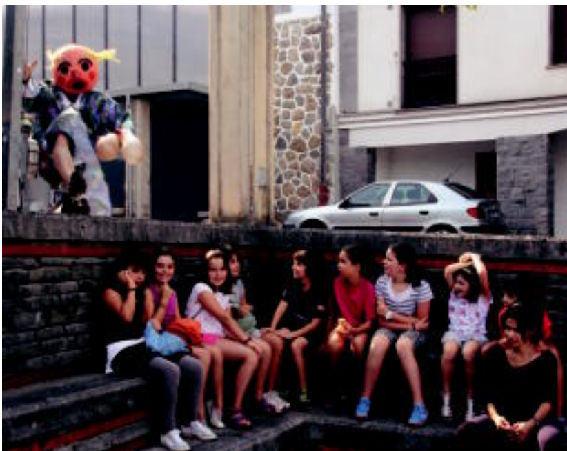
Alkizan buruhandiekin hasi zituzten jaiak, atzo arratsaldean. A. IMAZ