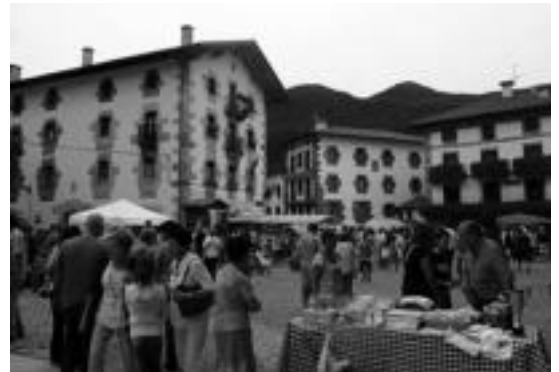
Pasa den urtean oso jendetsua izan zen Talo Eguna. SARA GOMEZ

Aurten ere, Leitzako Saralegi eta Villabona talogileek irekiko dute azoka. Bertan, baserriko tresneria eta animaliak egongo