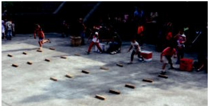
Golan, Alkizan haurrak lokotx biltzen. Behean, Zizurkilen Pirritx, Porrotx eta Mari Motots. A. IMAZ

'Nik maite dut euskara' lelopean, matrikula hilaren 17a arte zabalik du euskaltegiak 03