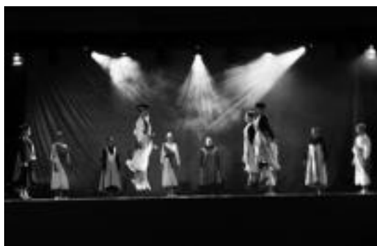
Ibarra-ko jaietan jende ugari izan zen Alurren emanaldia ikusten. HITZA