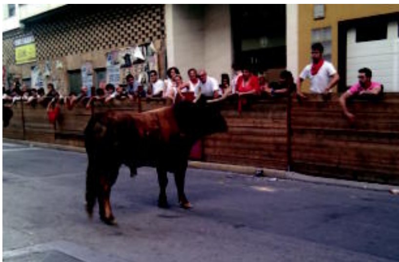
Murchante herrian ateratako argazkia. XABIER IZAGIRRE