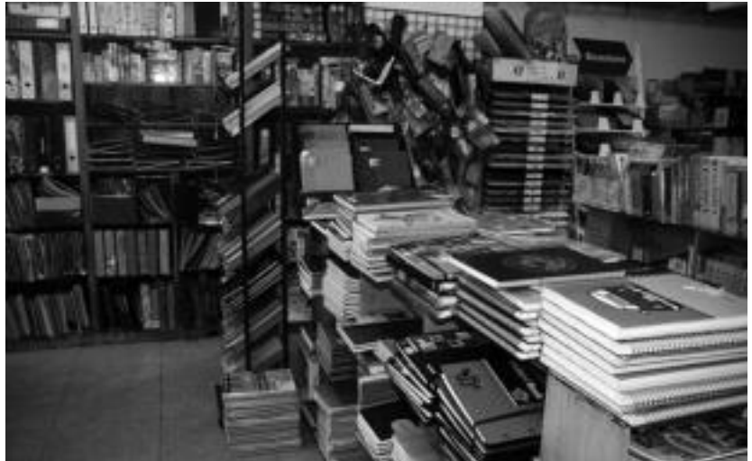
Eskolako materiala da familia askoren poltsikoan nabaritu den igoeretako bat. A. MAIZ

Igoeraren aurrean, Tolosa&Co elkartek hainbat bilera egin ditu. Komertzio asko eta era askotakoak biltzen direnez, erabaki bateratua hartzea ia ezinezkoa suertatu zitzaion. Hala, herriko dendek erdiek, norbere erabakiz, BEZaren igoera euren esku hartu eta ez aplikatzea erabaki du, urtarrila bitartean behintzat, eta horren berri eman dute erakuslelhoetan kartelak jarri. Oinetako dendetako jabeak izan dira bat egin, eta erabaki bateratua adostu dutenak. Horiek ere igoerarik ez dute aplikatuko, eta euren gain hartuko dute. Atzo oinetako denda guztietako ordezkariak Tolosako udalaxearen aurrean elkar-tu ziren honen berri emateko. Oinetako denda guztiek kartel bera zintzilikatu dute euren dendetan, herritarrei euren erabakiaren berri emateko.