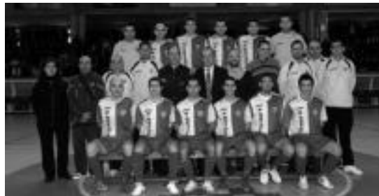
Salou areto futbol taldea Tolosara etorriko da. HITZA

tzak izan dituzte eskualdeko bi taldeentzat, hauen maila goraipatzearekin batera. Horrez gain, herri-tarrei Usabal kiroldegira ager-