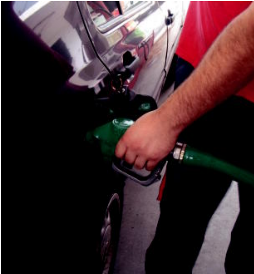
BEZa igo baino egun bat lehenago, jende ugari joan zen gasolindegietara autoaren depositua betetzera. iGL

Tolosako merkatarien erdiek BEZ zergaren igoera euren gain hartu eta prezioak ez igotzea erabaki dute; oinetako dendek erabaki bateratua adostu dute 02-3