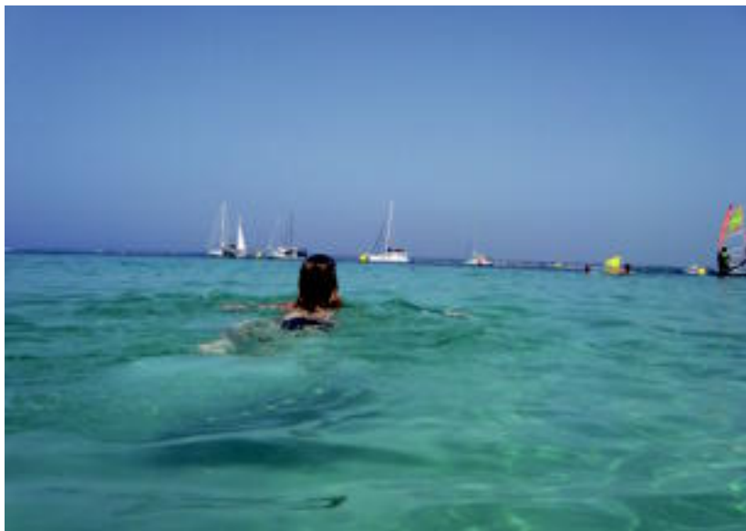
Mallorcako Es-Trenc itsasartean ateratako argazkia.