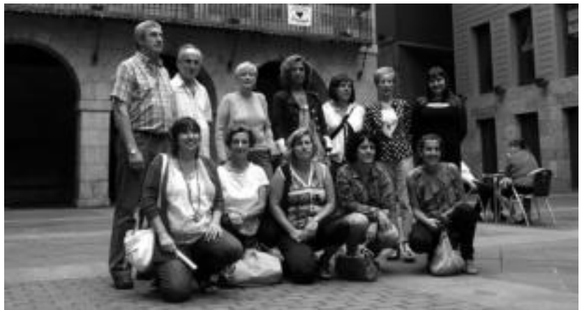
Tolosako oinetako dendetako ordezkari guztiek bat egin dute; BEZaren igoera euren gain hartuko dute. HITZA