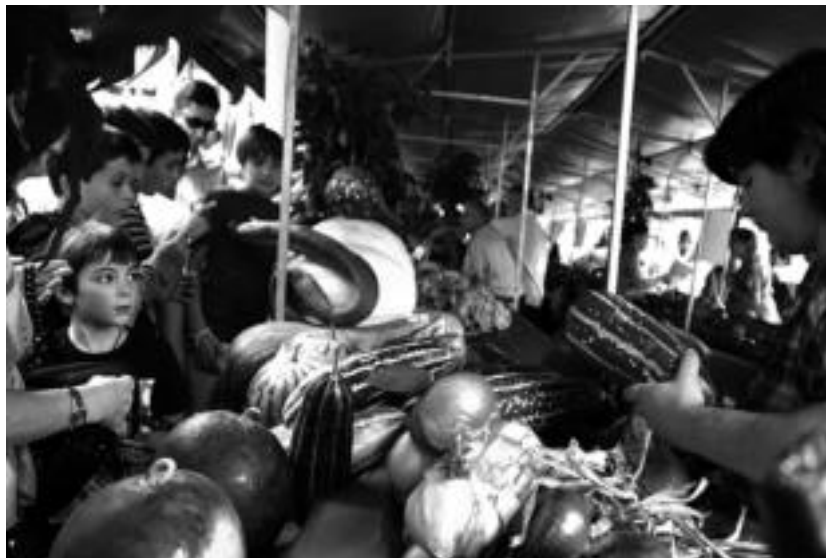
Ordiziako Euskal Jaietako atzoko azoka bereziaren une bat.