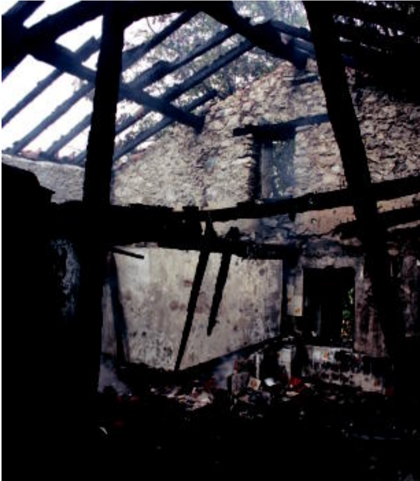
Naparrenea baserriaren egoera, atzo goizean, sutea jasan ondoren. I. TERRADILLOS

Asteartea, 2012ko irailaren 4a. IX. urtea. 2.393. zenbakia. tolosaldea.hitza.info