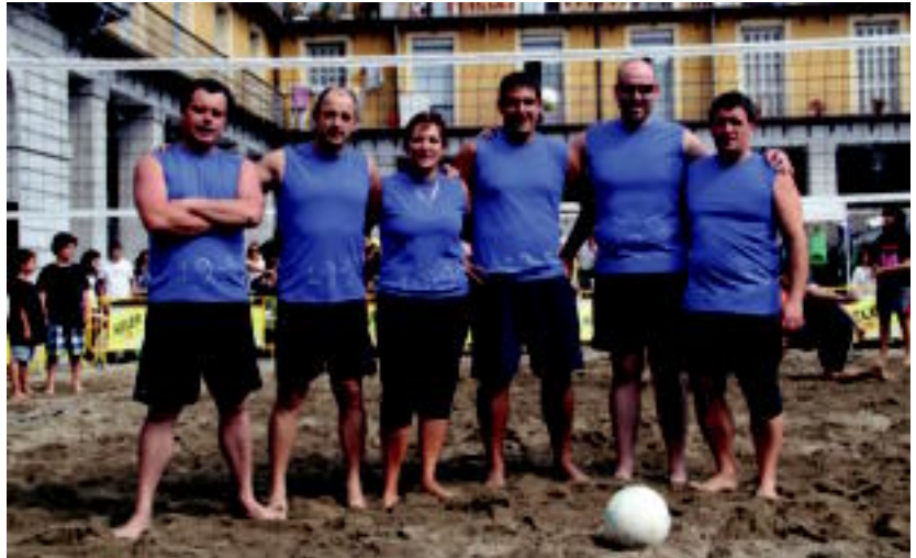
19/90 taldeak irabazi du aurtengo Udako Azken Festako boleibol txapelketa. HITZA

Guztira hamasei taldek parte hartu dute boleibol txapelketan. Irabazlea 19-90 izan da, Solana 4ean afaria irabaziz. Bigarren sailkatua 19-90 Tostada, 19-90an afaria irabaziz, eta hirugarrena Orbela taldea izan da, Orbela tabernariaren afaria eskuratuz. Euskal