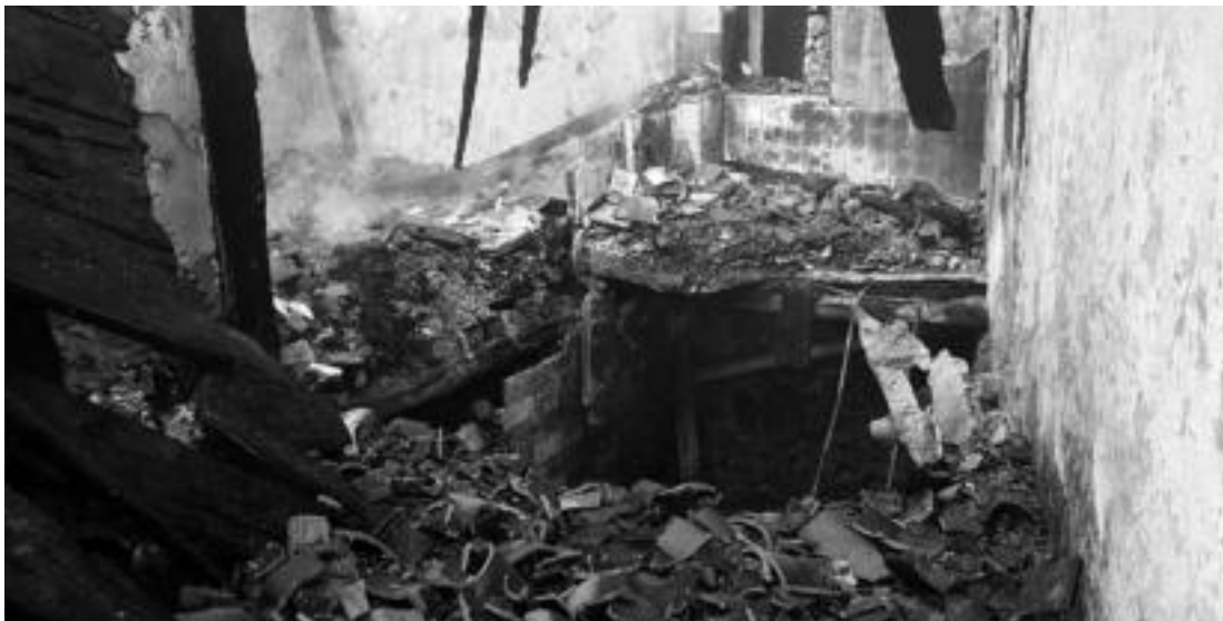
Solairu nagusia eta goiko solairua edo ganbara erabat kiskali ditu suak. Teilatuaren zati handi bat nahiz zoruaren zati bat erori egin dira. I.T.