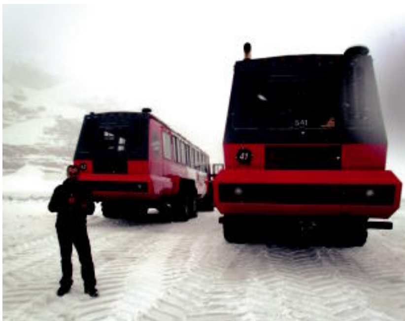
Banff-erako bidean, Kanadan, ateratako argazkia.