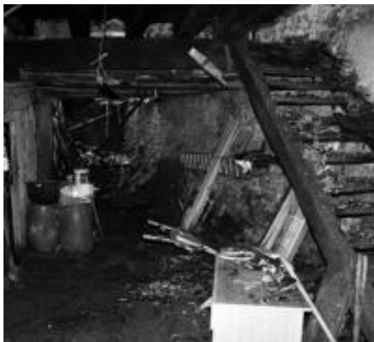
Beheko solairuak izan du kalte gutxi. I.T.

22:45 inguru zirenean piztu zen sua, antza, logelan izandako zirkuitulabur batek eraginda. Suaz ohartu bezain laster, bizilagunengana jo zuen emakumeak laguntza eske. Horiek izan ziren, hain zuzen, larrialdi zerbitzuetara hots egin zutenak suaren berri emanez. Suhiltzaileak, Gurutze Gorria eta Ertzaintza segituan gerturatu ziren ezbeharrak gertatu zen lekura.