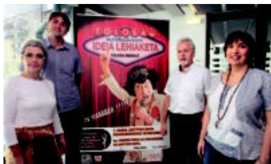
Merkat egitasmoaren bigarren fasearen aurkezpena egin dute. GORKA ESTRADA

Tolosa Merkat programa bigarren fasera iritsi da; helburua merkataritza jarduera biziberritzea da, horretarako laguntzak emanaz 02