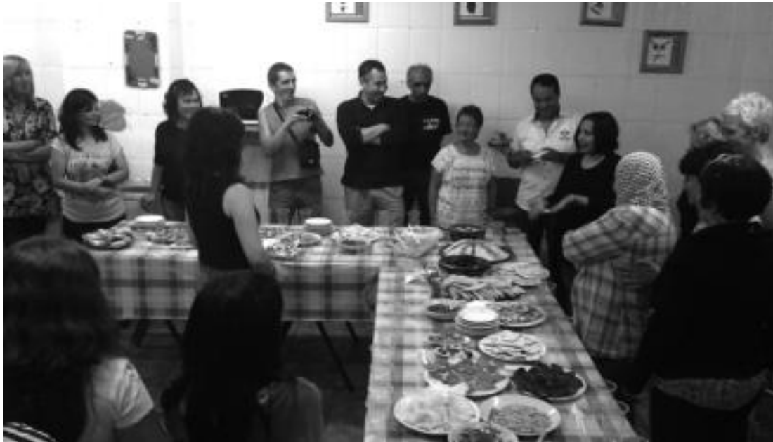
Ate irekien jardunaldia egin berri du Ereiteak, eta bertan hainbat herrialdetako jakiak dastatzeko aukera izan zen. IGL

Zuzendaritza batzorde berri batek abian jarri du berriro Ereite elkarte; larunbaterako afaria antolatu dute