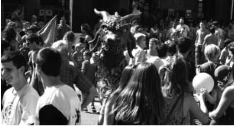
Villabonako Santio jaien lehen egunean erraldoi eta buruhandiak irten ziren kalera, atzo. A. IMAZ