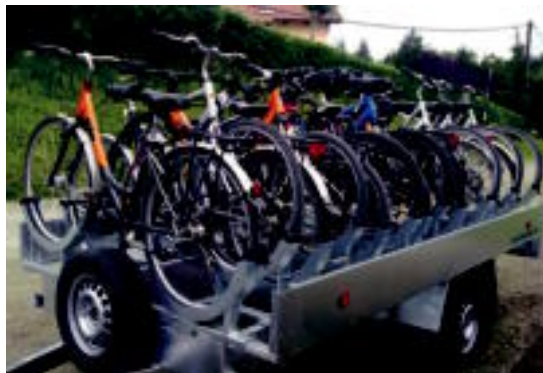
Bizikletak Lekunberriko Kantinan jarri dituzte. HITZA

Bizikleten alokairua bi ordu bost euro ordaindu beharko da; egun erdia 8 euro eta egun osoa 12 euro. Garraio eskatu ahal izateko alde aurretik egin beharko da eskaria, 948 604 644 edo 699 383 287 telefono zenbakietara deituz edota kantinaplazaola@gmail.com helbide elektronikora idatziz. Taldea hiru lagunetik gorakoa izan beharko da. Leitzatik itzulerako garraioan itzultzeak 8 euroko kos-