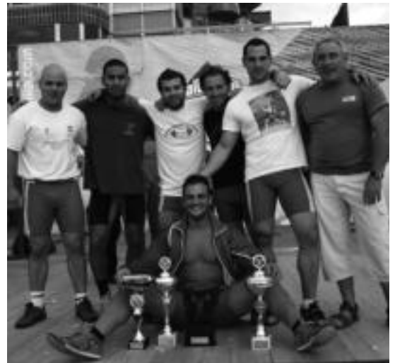
Zarauzko Herria Txapelketan Villabonako Danok Danena Halterofilia taldeko pultsulariak.