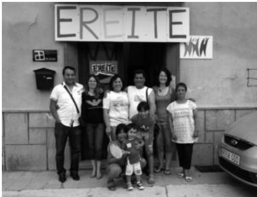
Ereite elkartearen zuzendaritza batzorde berriaren kideak, egoitzara joateko sarreran.