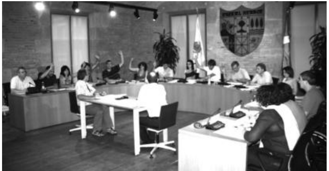
Bilduko eta Aralarrek ordetzariak hondakinei buruz eurek aurkeztutako mozioa onartzen, herenegun arratsaldean egindako osoko bilkuran. I.G.L.

Proposatutako biltza ereduak ezartzeko erabakia osoko bilkura hartuko duela zehaztu du mozioak puntuetako batean. Hurrengoan, «hondakinen kudeaketa egokirako lehen eragile nagusia herritarra da eta ondorioz, bidea herritarrekin batera egin behar da», dio mozioak, eta gaineratu: «Herritarrek parte hartze prozesuaren bidez prozesaturiko ereduaren inguruan era-