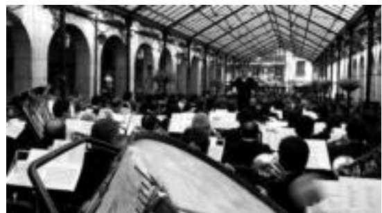
Udako emanaldian dantzarako doinuak eskainiko dituzte. HITZA