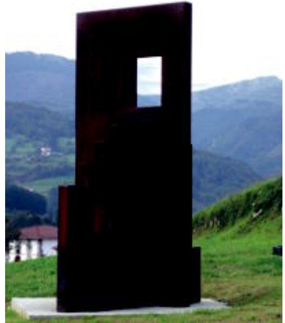
Emakume baseritarrei eskainitako eskultura dute Zizurkilen.

Hasteko, sarrera bat izan beharko du eta bertan, helburuak, metodologia edota egitura argitu beharko dira. Behin gaien sartuta, Zizurkilgo emakumeen egoeraren, baldintzen, beharren, interreguneen, indarguneen eta abarren azterketa zehatzak ondoko esparru eta arloetan burutu beharko dira: udalean, kulturen eta kirolean, hezkuntzan, lan munduan, hirigintzan, garraioan eta ingurugiroan. Indarkeria sexista