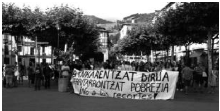
Sindikatuak eta gizarte eragileek deituta, 250 pertsona inguru elkartu ziren elkarretaratze zaratatsuan. IGL

KULTURA SAILAK DIRUZ LAGUNDUTAKO HEDABIDEA