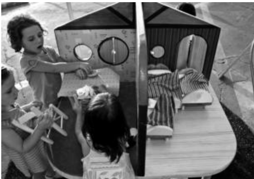
Hamabi eszenografiaren bidez, haur eta gaztetxek txotxongilolari izateko aukera izango dute. HITZA