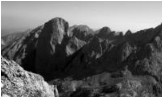
Picos de Europa mendien ikuspegia. HITZA

Izena emateko 688 69 86 42 zenbakira deitu edo info@oargi.org helbidera idatzi behar da. Horretarako azken eguna uztailaren 25a da. Izena ematerakoan 30 euro aurreratu beharko dira, Euskadiko Kutzaren ondorengo kontuan: 3035 0028 11 0281141038.