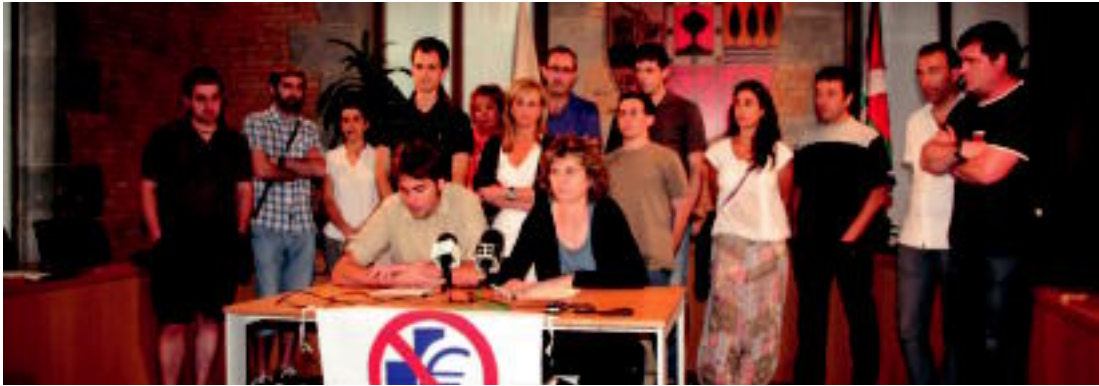
Eskualdeko alkateak Tolosako udaletxean elkartu ziren herenegun, TOPA koordinakundearekin bat eginez. I.GARCIA LANDA

Ostirala, 2012ko uztailaren 20a. IX. urtea. 2.388. zenbakia. tolosaldea.hitza.info