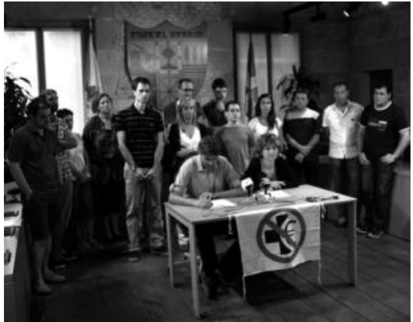
Eskualdeko alkateek TOPA herri koordinakundearekin bat egin zuten, beste behin. I. GARCIA LANDA

«Alkateen eta herritarren nahien kontra», 2011ko azaroaren 15ean Osakidetzak eta Asuncion klinikak hitzarmena sinatu zutela ekarri zuten gogora. Akordio ho-