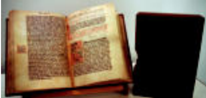
Codex Calixtinus liburuaren kopia bat ikusi daitezke Aranburun.