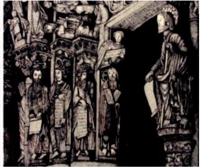
Lehen irudian Peregrinatio , argiaren bidetik erakusketaren lanetako bat ikusi daiteke, eta bigarrena Gipuzkoako Santiago-Bide Lagunen Elkartek bildutako obretako bat da.