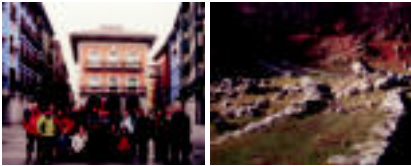
Gipuzkoako Santiago-Bide Lagunen Elkarteak zerbitu kidea Tolosan, eta erakusketako argazkiak eta bat.