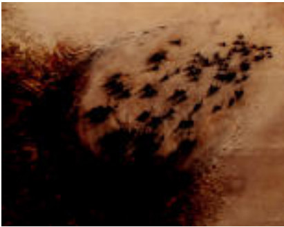
Juan Ramon Llavori Romatetek osatutako bildumaren margolanetako bat.

Elkarteak bulgoas du Tolosan, Santa Maria elizaren ondoan apaitz etxean. Elkarteak kideak ostegunetan, 19.30etik 20.30era, izaten dira bertan. Bestalde, 902 70 60 60 edo 675 70 95 86 telefono zenbakietara dugu daitezke informazioa jasotzeko.