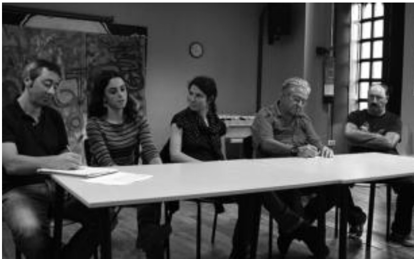
Udal ordezkariak eta sanjoanetako zenbait eragilek egin zuten jaien balorazioa. I. URKIZU