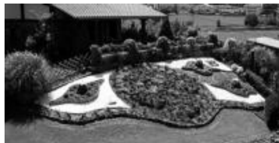
Lorategi ederrekin aurkezten dira berastegiarrak lehiaketan. HITZA

Leiho, balkoi eta terraza lehiaketa, lorategiena eta baratzeena egingo dituzte; gaur da izena emateko azken eguna