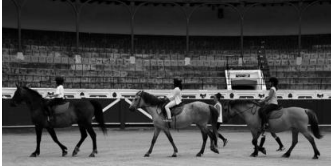
Tolosako zezen plaza leku aproposa da zaldiekin ikastaroak emateko. I.G.L.

Guztira 30 ikasle inguru daude, beste urte batzuetan baino gutxiago. Launako taldeak egiten dituzte, horrela irakasleak hobeto egiten du jarraipena. Ez dago gutxieneko urterik ikastaroan parte hartzeko. «Aguan zortzi urteko haur bat igotzen da zaldira eta hasiera batean blokeatu egiten da, eta sei urteko beste haur