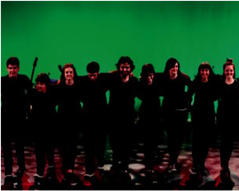
Oinkari dantza taldearen Ametsetan ikuskizunean ariko diren bederatzik musikariak. HITZA