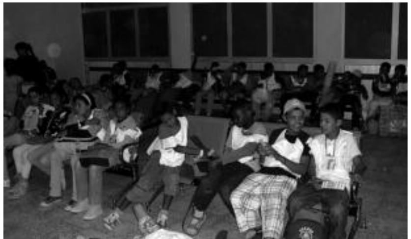
400 haur baino gutxiago etorri dira aurten Euskal Autonomia Erkidegora udako bi hilabete igarotzera.