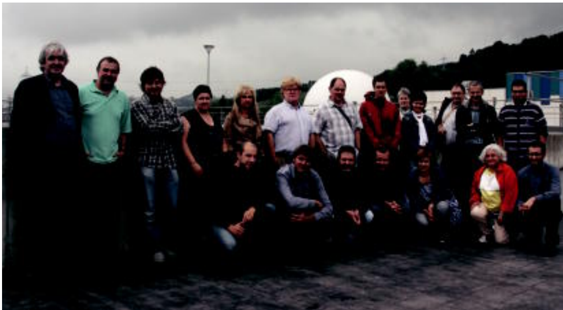
Udal ordezkariak eta teknikoez uraren ziklo osoa egiten duten azpiegiturak bisitatu zituzten; Baliarrainen, Ikaztegiaren eta Adunaren izan ziren. E. MAIZ