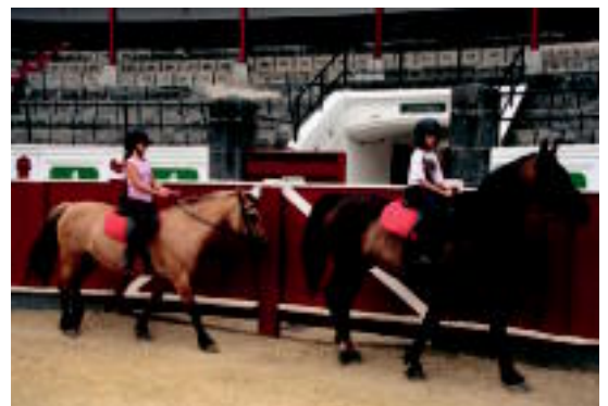
Tolosako zezen plazan aritzen dira ikastaroa egiten. I. GARCIA LANDA

Zaldikide elkarteak zaldiekin trebatzeko ikastaroak antolatzen ditu Tolosako zezen plazan; helburua «hasiera batean egon daitekeen ikara hori kentzea» dela diote ◊3