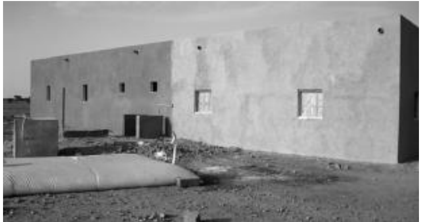
Saharar lurralde askean Tolosaldea Sahararekin elkartearen laguntzaz eraiki duten ikastetxea. HITZA