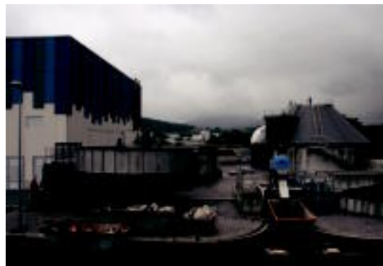
Adunako industriagunean eraiki dute. E. MAIZ

zatika bada ere, martxan jarri dute araztegiak dituen hiru faseak. Duela hiru hilabete jarri zuten martxan lehen zatia, eta ez da hilabete pasa azkena funtzionamenduan jarri zutenetik. «Lehen emaitzak jada jasotzen ari gara, baina emaitzak bere osotasunean jasotzeko beste lau edo bost aste