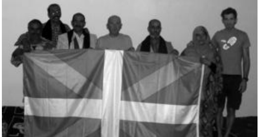
Tolosaldea Sahararekin elkarteko kideak Miyic herriko alkatea eta ikastetxeko ordezkariekin. HITZA

Errefuxiatuen kanpalekuetako Bir Lehu herriarekin dago anaituta Tolosa. Bada, anaitasun horri erantzunez, elkartasun proiektua ari da gauzatzen bertan udala. 18.000 euroko diru laguntzarekin ur biltegiak eta hodi-terria aldatu dituzte, lehengoak ura kutsatzen zuelako. Biltegi guztiak ezin izan dira berritu, ordea, eta egunotan gurean da bertako alkatea Tolosako Udalarekin duten hitzarmena sinatu eta laguntzarekin jarraitzeko.