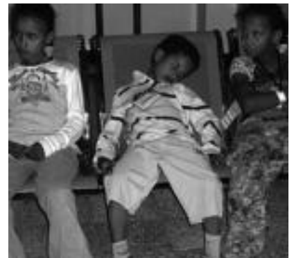
Ikastetxe berriko sukaldea. Eskuinean, uda gurean igarotzera datozen haurrak aireportuan. HITZA