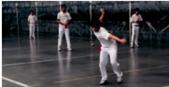
lako Transernio Pilota Txapelketako partida, Adunan. I. GARCIA LANDA

Uztailaren jokatzeko dira kanporaketa partida guztiak, eta fina-