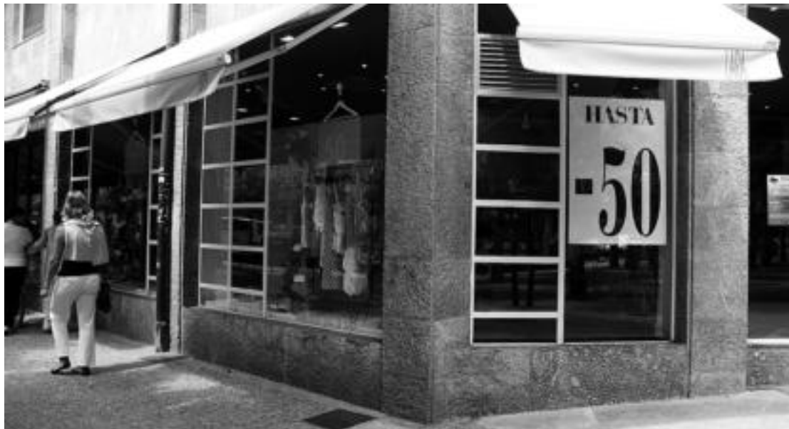
Pasa den astelehenean hasi zen udako merkealdia, eta merkatariek udaberriko galerak gaintzea espero dute.

Bide horretan, Tolosaldeko merkatarien aldartea ona dela