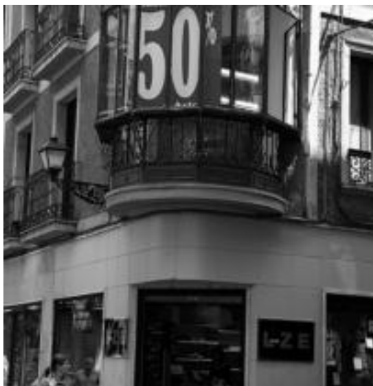
Inoiz baino eskaintza hobekoak izango dira aurten. I.URKIZU