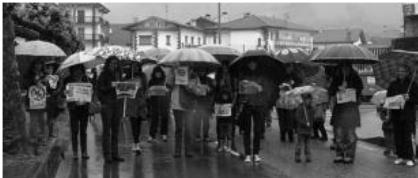
Murrizketak salatzen pasa den maiatzan, Leitzan, eginiko elkarretaratzea. HITZA

Honek guztiak, hortaz, eragin negatiboa izango du, hezkuntza kalitatea jaisteko arriskua baita; «ordezkapenak gaixoaldiko 15 egun betetzen diren arte betetzen ez badira, ordura arte bi talde elkartu beharko ditugu, eta gure eskola txikia denez, haur