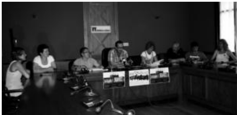
Herenegun egin zuten Kulturantz ekimenaren aurkezpena, Ibarra Udaleko eta Alurreko ordezkariak.