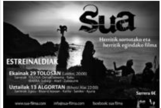
Sua filmaren estreinaldia iragartzen duen kartela. HITZA