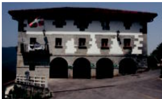
Udaletxea herriko plazan bertan dago. I.G.L.