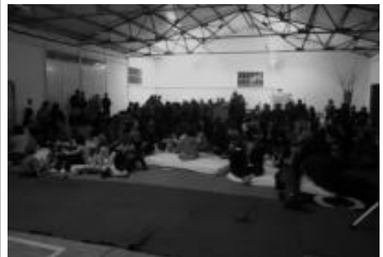
Filmaren aurre estreinaldia, Arabako Ozaeta herrian.

Sarreraren kostua 6 eurotan jarri dute Sua filmaren egileek. Emanaldiaren aurretik, ezusteko batzuk egongo direla ere azaldu nahi izan dute. Duela hamar urte, Eneko Aritza film laburra aurkeztera limusina batekin azaldu ziren EALeko kideak. Batek daki gaurkoan zein ezuste izango duten esku artean.