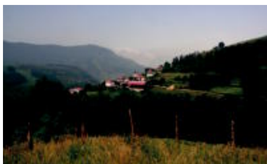
Orexa naturaz inguratuta dago. I.G.L.