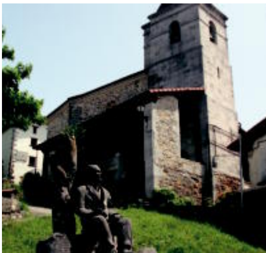
Orixeren eskultura eta Gurutze Donearen eliza. I.G.L.