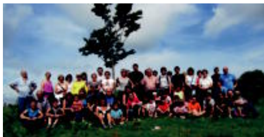
laz jende asko elkartu zen ibilaldia egiteko, HITZA

Bihar, hilak 30, mendi ibilaldi txiki bat burutuko dute, Bedaion. «Dagoeneko ondoan ez dauden gazteak gogora ekarri asmoz egingo dugu ibilaldia. Maiz, bizitzak bidean zehar oztopo ugari jarri izan dizkigu. Ez behar edo osasun arazoak direla medio, bihar, oztopo horiek samurtzen saiatuko gara», argitu dute antolatzaileek. Lagun artean eta jai giroan pasako dute eguna.