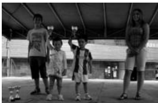
Pilotalekuan jolaeen ibili ziren haurrek sariak ere jaso zituzten. A. IMAZ