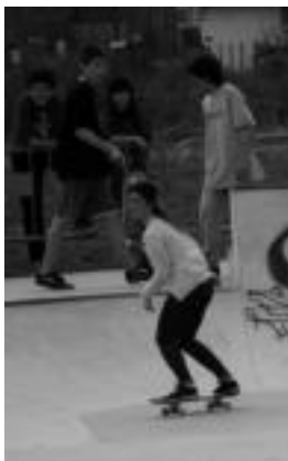
laz izan zen lehen txapelketa. I. URKIZU