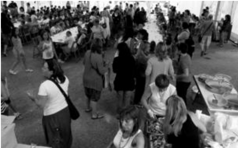
Herriko plazan jarri zuten jangela txiki gelditu zitzaizen asteasuarrei haurren eguneko bazkarian. A. IMAZ