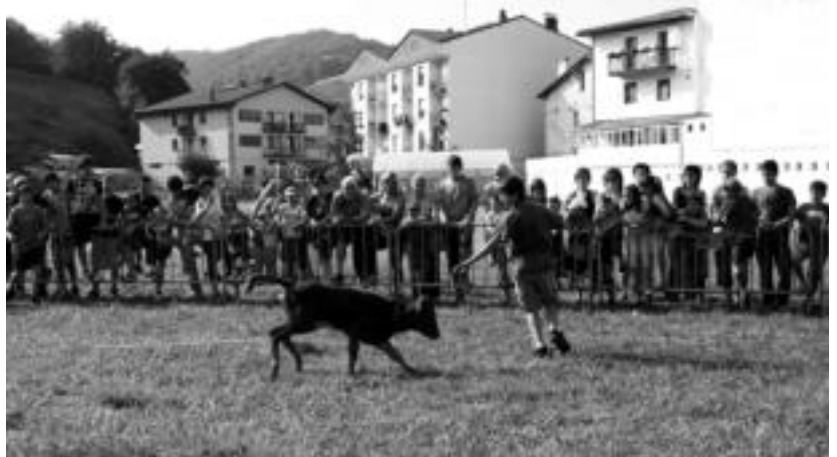
laz bezala, aruten ere zezentxoak eta poneyak egongo dira Asteasuko jaietan. MAIER UGARTEMENDIA

Tolosaren kasuan, jaiek etenik ez dutela dirudi. Sanjoanak amaitu berrikan, bi auzok hartuko dute festaren lekukoa. Egitarau oparua antolatuta dute gainera, Amartzon eta Urkizun. Irudimenak ez du mugarik, eta hori argi utzi dute auzotar hauek.