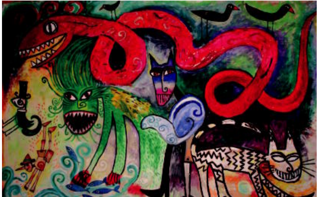
Erakusketan, hainbat koadro koloretsuk Pinotxoren istorioko zenbait pasarte irudikatzen dituzte. I. URKIZU

Pasa den ostiralean inauguratu zuten Ni Pinotxo naiz erakusketa, eta datorren irailaren 23ra bitarte ikusgai izango da, Topic zentro-