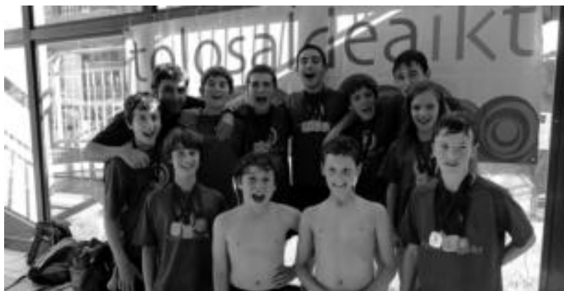
Gipuzkoako txapelketa parte hartu zuten igerilariak; goian, alebin mailakoak, eta, behean, eskolartekoak. HITZA

txienekoa lortzeko ehuneko gutxietara geratu zen.