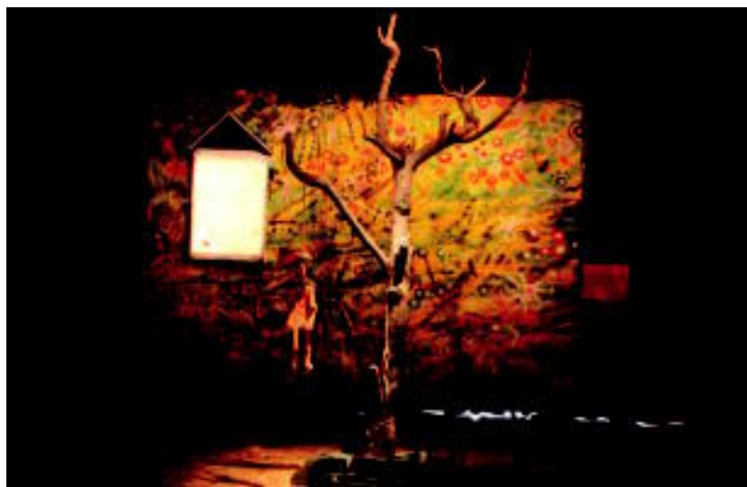
Pertsonaiaren jatorrizko bertsiora hurbiltzea da erakusketaren helburuetako bat. I. URKIZU