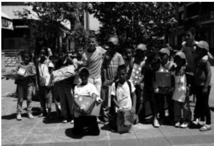
7 eta 12 urte bitarteko 20 neska-mutil izango dira Tolosaldean. Irudian, atzo ailegatu ziren 15 gaztetxoak. ir.

IBARRA ▶ Festa batzordearen bilera orokorra izango da etzi, ostegunean, 19:00etan, udal-etxe batiar aretoan. Herriko talde, elkarte, eragile zein norbanako guztiei egiten zaie bertaritzeko deia.