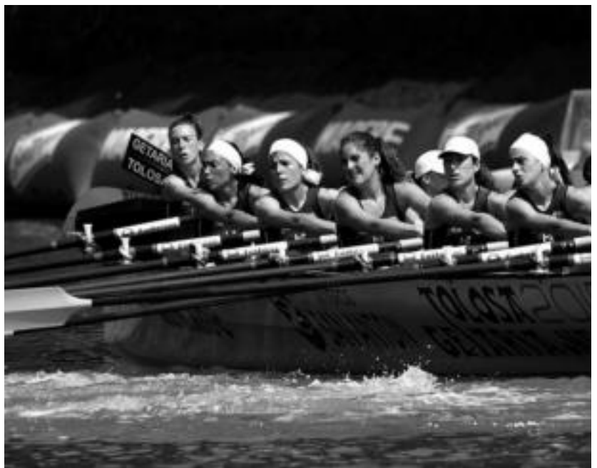
Portugaleten jokatuko dute aurtengo lehen estropada puntuagarria. HITZA

Gainera, zuen zalantzak bioaniztasunetik@hotmail.com helbidera idatziz argitzen ditu. Jarraitu beti bezala idazten, uda badator, eta bada zer ikusi etxetik bi pausora.