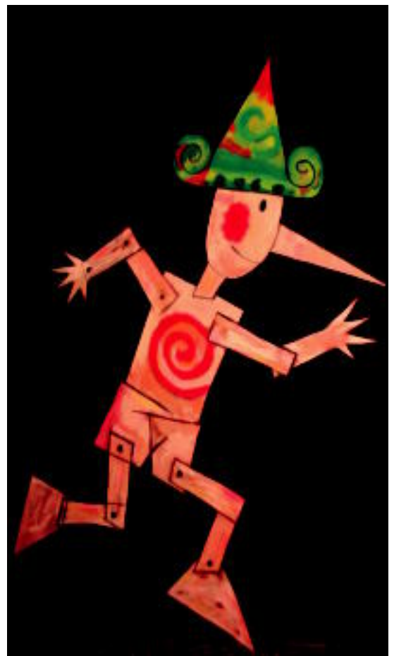
Pinotxo pertsonaia 1882an sortu zen. I. URKIZU