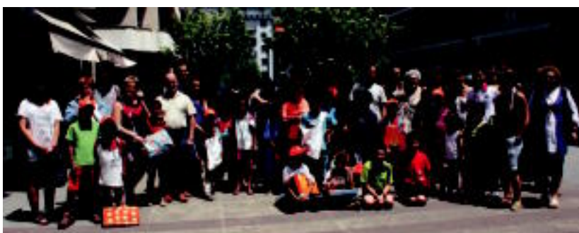
Atzo 15 gazte iritsi ziren; irudian haurrak eta beren familiak. I. TERRADILLOS

→ Pinotxo pertsonaia, gertuago. Tolosako Topic zentroak erakusketan berria jarri du: Ni Pinotxo naiz . Helburua Carlo Collodik idatzitako jatorrizko istorioa ezagutzera ematea da, eta horretarako, bisita antzeztuak egingo dituzte. 05