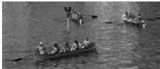
Herenegun goizean izan ziren estropadak, Orian. E. SARASOLA

Finaletako emaitzei dagokionez, kadeteetan Izagirre-Muñagorri bikoteak irabazi zion Lekuona-Agüerori, 25-21. Eta nagusietan Altuna-Rabadan bikotea izan zen garaile Lopez-Telleria 19 tantotan utzita.