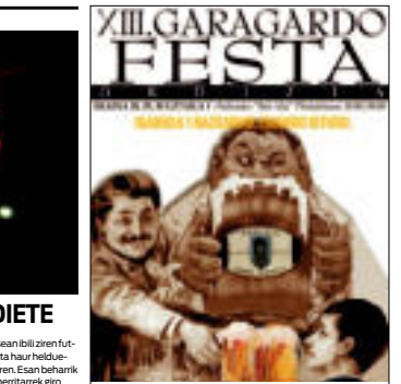
Antolatzailea: Odiizia Rugby Elkarteak. Laguntzaileak: Odiizako Udala

Eskualdeetako herri eta txoko gehienek jarraiki, Bidegoianen sua piztu zuten larunbat gauean. Gu-berri gorabehera 70 pertsona elkartu ziren San Joan besperako suaren inguruan. Etxetik eramandako afari mokadua eginez eman zieten hasiera ospa-