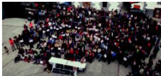
Leitzako eta Aresoko bizilagunak, Leitzako plazan.

Leitzako eta Aresoko 500 bat pertsonak gaur egun dagoen sistemaren alde egin dute, hau da, osasun etxean 24 orduko zerbitzuaren alde o3