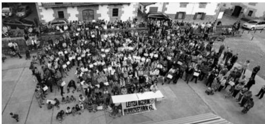
Leitzako eta Aresoko 500 lagun baino gehiago elkartu ziren iragan ostiralean osasun arloko murrizketen aurkako jarrera azaltzeko. PABLO FEO

Ostiralean hasiko dira San Pedro jaiak Leaburun, eta larunbateko herri afarirako eta herri kroserako izena emateko azken eguna gaur izango da. Herri afarirako txartelak erosteko Leaburuako ostatura edo udaletxera joan behar da, eta herri krosean parte hartu nahi duenak, berriz, udaletxera deitu beharko du izena emateko.