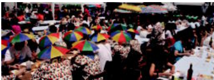
Kuadrillen bakarrak 1.600 lagun inguru elkartu ziren, larunbatean, txiki gelditu zen Euskal Herria plazan. Eguzkitik gordetzeko hamaka eskaintzuz busi ziren bertan.