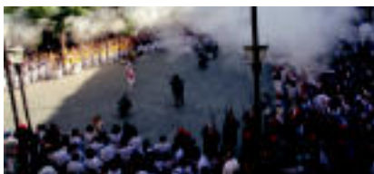
Txupinazoa lehortzean hasi ziren erraldoiak dantzan, eskopetarien tiroak ondoren itziti ziren.