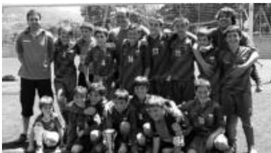
Alebinek bikain bukatu dute denboraldia, garaipen batekin. HITZA

Villabonako futboleko taldeak kostata lortu zuen finalerako txartela. Finalerdia Venta de Bañosen aurka jokatu zuen, eta berdinketa izan eta gero, penaltita lortu zuten billabonatarrek garaipena.