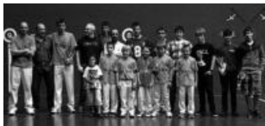
Zesta-punta txapelketako familia argazkia.