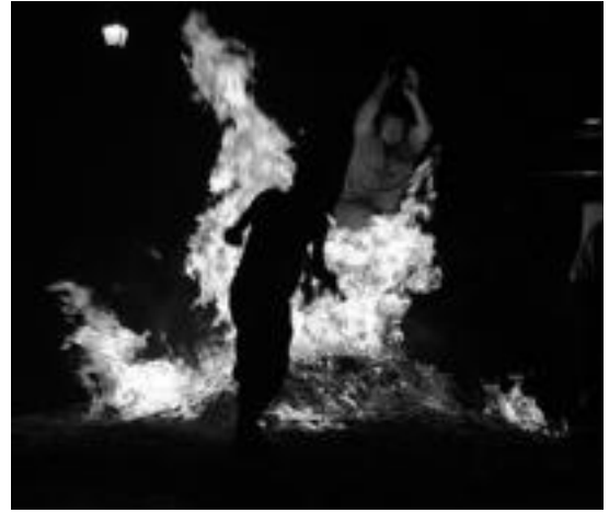
Suaren gainean salto egingo dute herritar ugari bihar. I.GARCIA

Hainbat dira suaren atzetik dauden sinesmenak. Horiek albo batera utzita, eta suaren beraren magiaren eraginez edo, xarma berezidun gaua izan ohi da biharkoa.