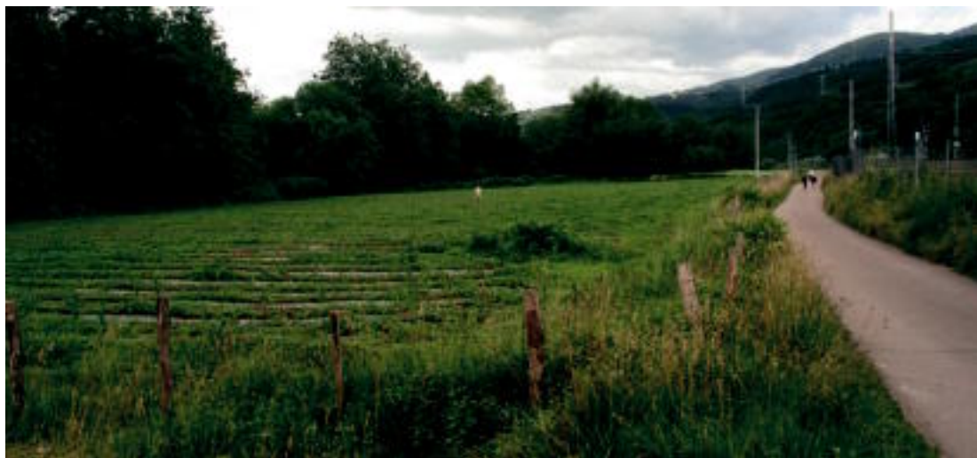
Villabonatik Anoetarainoko bideak trenbidea jarraitzen du. Behean, Villabonako Errebote plaza eta Anoetako eliza. I. URKIZU

Errebote plazatik Berdura plazak zubi lanak egingo ditu, Jesusen Bihotza elizara iristeko. Hain zuzen ere, parean hartu beharko