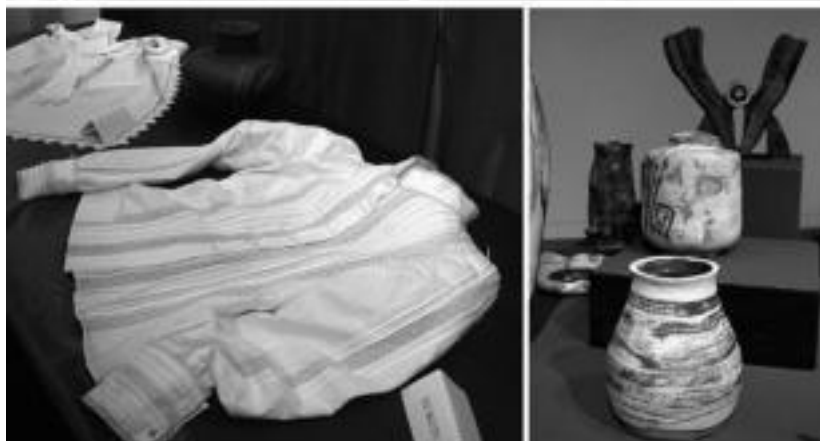
Artearen hainbat alorretako lanak ikusi daitezke Aranburu jauregian uztailaren 7a arte. HITZA

nek batera jarri ditugu artelanak, denak nahastuta, elkarri laguntzen dira. Eta denak bat gehiago sentitu dira, eta harro ere bai, Aranburu jauregian jarri direlako artelanak».