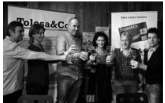
Merkatariek eta ostalariak topa egin zuten, elkarlanean harira.

Urtero erakusleihoak apaintzeko, dantzarien alpagatak eta uztaixikiak banatzen dizkiete merkatariei, eta aurtan, Udaberri dantza taldearen urteroko lana-