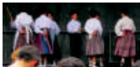
Alurr dantza taldearen emanaldia, plaza.

ETB2ko Conquistour saioko grabaketa egingo zutelako iragarri bazuten ere, ostiralean prentsaurrean salatu zuten ETB2ko Hostoi ekoiztetzaiek «azken momentuan» grabaketa bertan behera utzi eta erabaki zuten «segurtasuna eta grabatzeko arazo teknikoak» argudiatuta. «Gure ustez ulertzen da horrelako programa batek bi atzokia horiek erabiltzea. Proba euren aurrean egin