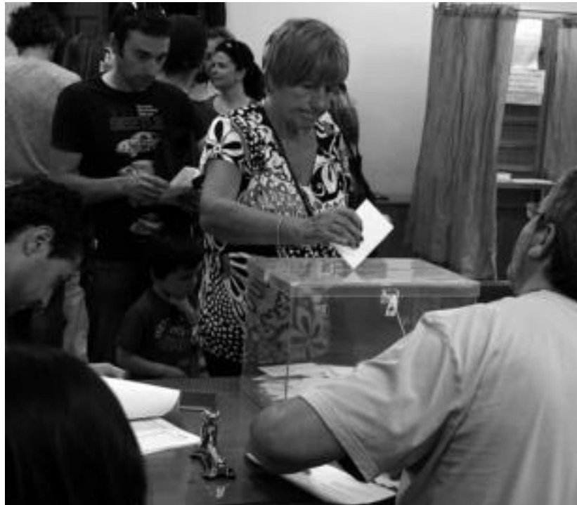
Larramendi auzoko zenbait bizilagun, Arkaute etxean botoa ematen, larunbatean. R. CALVO

Bozkatzeko aukera zutenen %60,6ak eman du botoa; udalak «herriaren garaipena» izan dela esan du