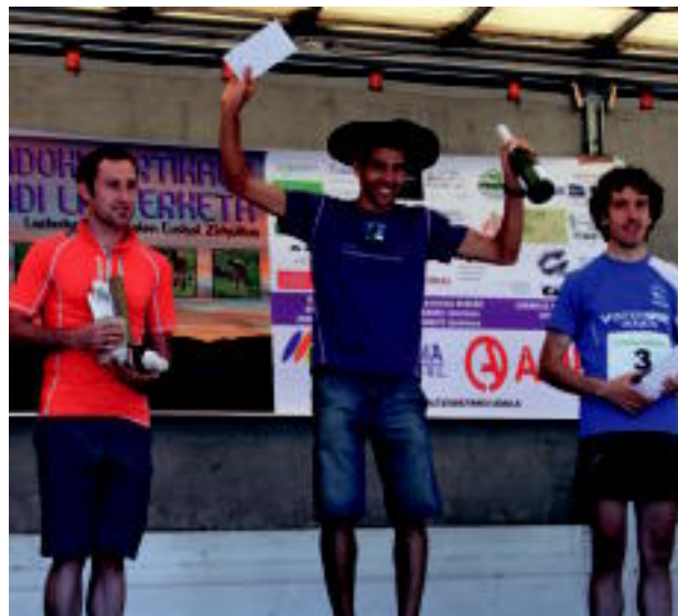
Ibarbia, Combarieiu eta Vazquez lasterkariak osatu zuten nesken podiuma; mutiletan, Lariz, Ait Chau eta Beunza izan ziren sariak jaso zituztenak. M. GALARRAGA