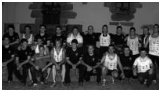
Errezilgo eta Bidegoiango taldeak (beltzez), giza proba desafioan.

Errezilgo San Antoni festei amaiera emateko, larunbatean giza proba antolatu zuten Errezilen. Bidegoiango taldearen aurka egin zuten, eta etxekoek irabazi zuten. Bidaniak 35 plaza eta 14 metro egitea lortu zuen. Errezilek, aldiz, 39 plaza egin zituzten. Bidaniko festetan izango dute errebantxarako aukera