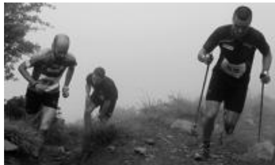
Lasterkari askok, zati batzuetan oinez egin zuten Txindokira bidea. M.G.