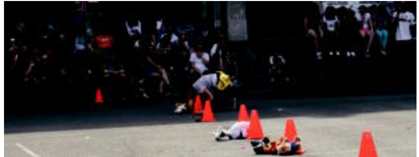
Koadrilen Egunean giro ona izan zuten herrian; joko ugari egin zituzten bazkaldu eta gero, plazan. E. MAIZ