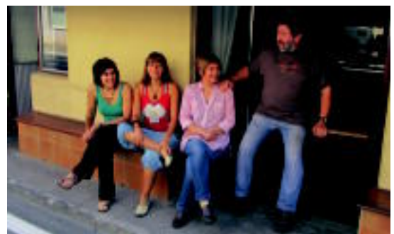
Agirrebarrenaren senitartekoak, Lizartzan duten tabernaren atarian. A. IMAZ

Lizartzako presoak atzo bete zituen 10 urte kartzelan; herritarrek preso ohi bat gonbidatu dute gaur, 20:00etan, hitzaldia eskaintzeko ◦6