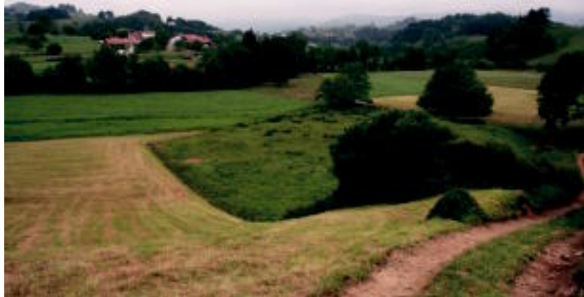
Zalduko zelaiak, Unbaranbe baserritik gertu hartutako ikuspegitik. I.G.L.

Erreka gurutzatu ondoren hasten da ibilbideko aldarrik pikoena. Hori bai, ez da oso luzea, eta aldaparen bukaerara iristean ikusten den pasaiak merezi du esfortzua. Aldapak Sagargatzegi baserri azpiraino eramaten du, eta hor bidea ezkerretara hartu behar da. Berehala, Zalduko zelaiak agertuko dira, aldaparen bestaldean. Horixe izango da ibil-