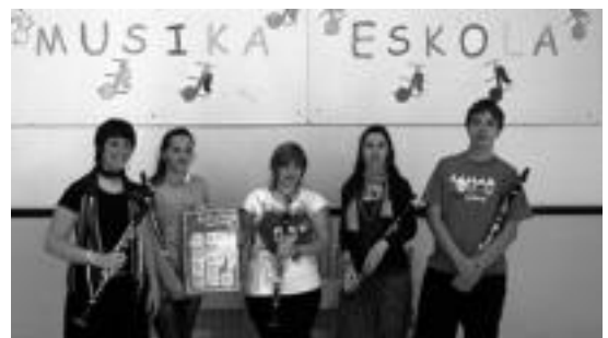
Kontzertu pedagogikoa eskainiko dute musikariek.

Horrela, beraz, XVII. mendeko Purcell-ekin hasi, eta Lou Bega-ren Manbo n°5 -eraino, klarinete jotzaileek obreei eta egileei buruz ere hitz egingo diete bertaratuako entzuleei. Modu honetara, adin guztiei begirako kontzertu pedagogiko desberdina eskainiko entzuleei. Modu honetara, «Badi-rudi kontzertu pedagogikoak umeentzako soilik direla. Gure emanaldiarekin, entzuleek kontzertua amaitu ondoren musikari buruzko informazio eta datu berriak izango dituzte».