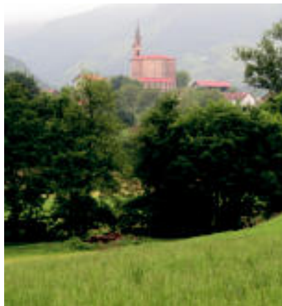
Ezkerreko irudian, Elizmendiko eliza, Zalduko zelaietatik begirituta; eskuinekoan, Donemiliagako Zimiterioa. I.G.L.