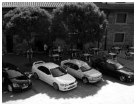
Hainbat auto ikusteko aukera izango da goizean zehar, plazan. HITZA

IV. Euskal Herriko Bakarkako Segatxapelketa izen ematea igandean bukatuko da. Izena eman nahi duenak, almitzasega@yahoo.es helbidera idatzi edota 615 74 34 11 (Tomax) telefono zenbakira deitu beharko du. Almitzak antolatzen du segatxapelketa, eta Tolosako saioa hilaren 17an izango da. 11:00etan sailen eta txanden zozketa egingo da, eta 11:30ean ekitaldia hasiko da. «Gazte eta gaztetxoek luza nahi diegu bereziki animatzeko deia», diote Almitzatic.