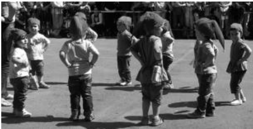
Villabona eta Zizurkilgo Jesusen Bihotza ikastolako haurrak ikasturte amaierako jaialdian. HITZA