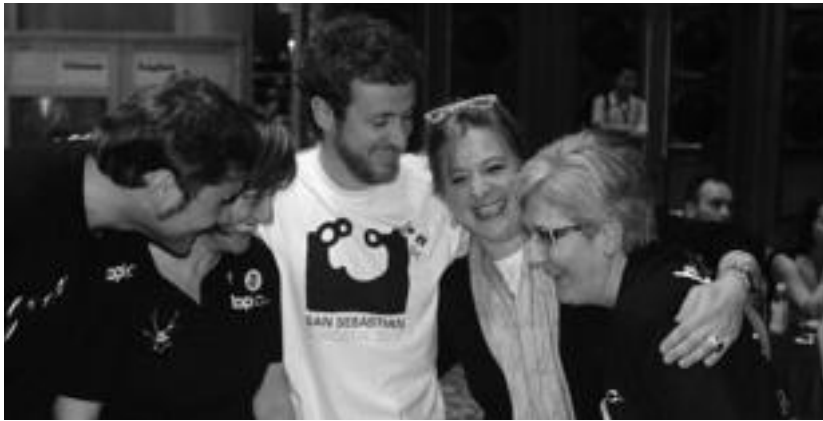
Ordezkarri guztiek «oso pozik» azaldu dute beren burua. HITZA