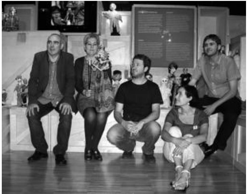
Tolosa-Donostia hautagaitza defendatuko duten erakundeetako ordezkariak, Topic zentroan. I.G.L.

Txinan egingo duten hautagaitzaren aurkezpena berezia izango dela esan zuten, ezustekoak prestatu baitituzte. Bestalde, orain gutxi Topic museoa Silleto saria jaso izana goraipatu zuten eta horrek izendapena jasotzeko aukerak zabalduko dizkiela esan zuten. Tolosa-Donostiarekin batera