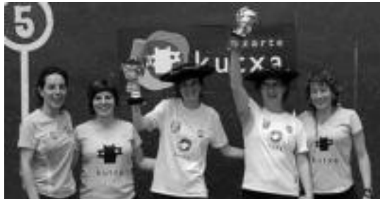
Gipuzkoako Txapelketa Herrikoia irabazleak, sariekin. HITZA

Nahiz eta txapelketa herrikoia jokatu, pilota saio jendetsua anto-