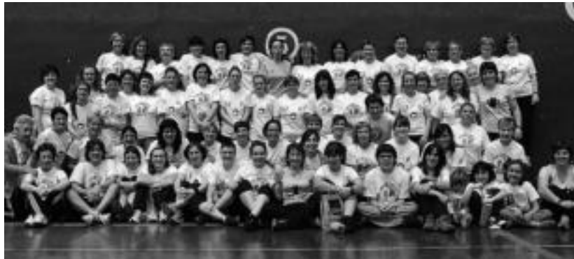
Emakumea Pilotari Egunean parte hartu zuten kirolariak.

Urtean zehar paleta ikastaroan parte hartzen duten emakumeei zuzenduriko festa da, eta bertan, Gipuzkoako Txapelketa Herrikoiko azken fasea jokatu zuten. Aurtengoan, Zarautz eta Hernaniko bikoteak iritsi ziren finalera, eta Zarauzko bikotearentzat izan zen txapela. «Oso partida ona jokatu zuten. Maila oso oneko bikoteak dira, eta pilotakada askoko partida izan zen. Hernanikoek huts batzuk egin zituzten, eta azkenean Zarauzko bikotea nagusi-