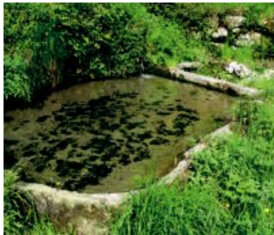
Ibilbidean aska eder honekin egingo dugu topo. Aurrera jarraitzen baldin badugu, sales baserrira iritsiko gara. A. IMAZ

rrerako autobus geltokira iritsiko gara, hau da, ibilbidearen amaiera puntura. Autobusaren ordutegia begiratu, eta zerbitzu publikoaren zain geldituko gara bertan. Autostop egin nahi duenak ere, erraz aurkituko du Tolosara eramango duen autoa, teoriarik behintzat.