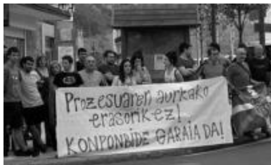
Anoetan herenegun arratsaldean egin zuten elkarretaratzea. HITZA

Aurretik zenbait herritan epaiaren aurkako elkarretaratze-