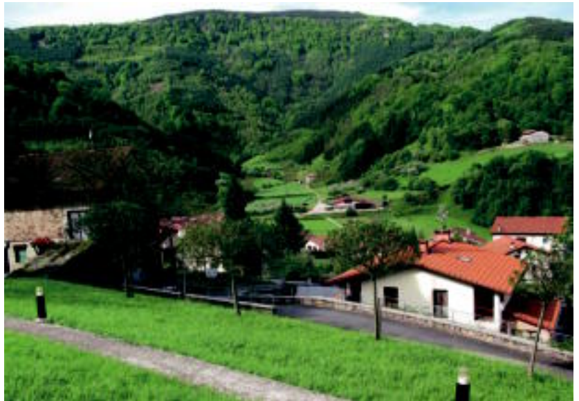
Herri gunetik behera begiratzen badugu, Sales baserrira doan bidea ikusiko dugu. A. IMAZ

Galipotarekin topo egiten dugunean, zalantza piztuko zaigu, agian. Eskuinera edo ezkerredera egingo dugu orain? Aurrean dugun bailarako azken baserria aurkitu behar dugunez, eskuinera egingo dugu. Haztegiaren ondortik pasatzean, bigarren bidegurutzearekin egingo dugu topo, den-