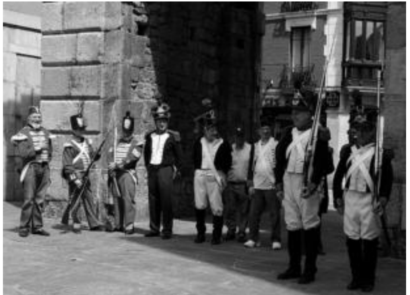
Euskal Herria plazan eta Trianguloan egingo dituzte tiroketak, ekainaren 3ko alardean. I. URKIZU

Honen harira, Andia kideek Europar zehar guduen antzezpenean duten garrantzia eta interes turistikoa nabarmendu nahi izan zuten. Waterloo-ko gudua errepresentazioak ia 3.000 lagun biltzen ditu parte hartzaileen artean, eta 2015ean bertan izan nahi dute Tolosako taldekoek.