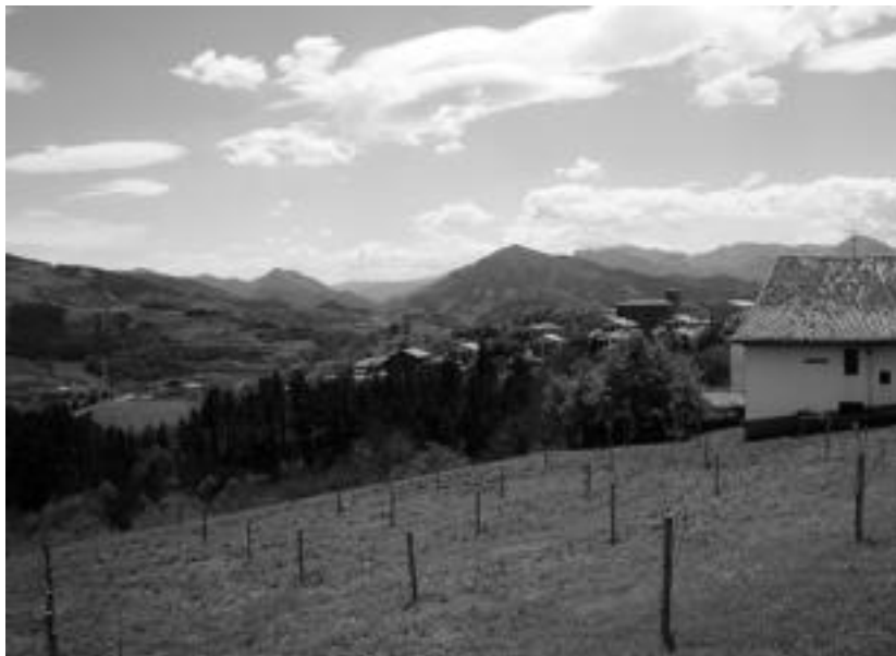
Basoan aurrera joanez, Alkiza, Anoeta eta Hernialderen muga adierazten duen seinalera iritsiko da ibiltaria. Bidearen hasieran, berriz, Hernialderen ikuspegi ederraz gozatuko du. IT.

Hernialdetik Alkizara doan mendi-bidea erabiliko du ibiltariak. Alkiza begiztatu, eta bide polit eta lauan Hernialderako bidea hartuko du ostera, lau kilometro t'erdi egin arte.