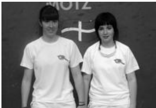
Gallurraldek eta Senperenak irabazi dute txapelketan. HITZA

Alegiako eta Ikaztegietakoko pilotalekuan hainbat partida jokatu dituzte, asteburuan. Gaur, 19:00etatik aurrera Alegian jokatu dituzte, Lau t'erdian: kadete mailan, Cisnerosen aurka jokatu du Intxurreko Goikoetxeak; jubenil mailan, Kortabarria izango du aurkari, Intxurreko Mujika pi-