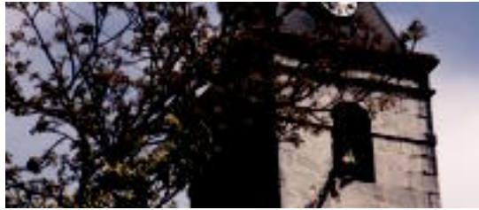
Atzo eguerdian hasi zituzten jaiak, Orexan. R. CALVO