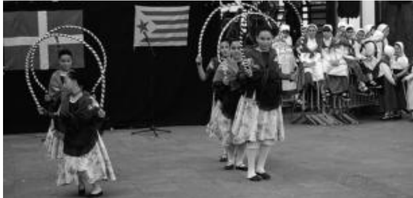
2010ean izan zen bi dantza taldeetako belaualdi gazteenen arteko lehen elkartrukea. HITZA

Horrela beraz, eta helburu horrekin jarraitze aldera, hainbat jolas antolatuta dituzte Usabalgo