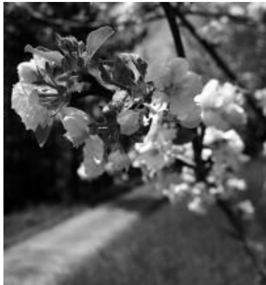
Udaberri koloreek atseginago egin ohi dute ibilaldia. IT.

Herniori zor dio izena bere magalean sortu zen herri honek. Mendi buelta atsegina egin nahi duenak bere inguruan aukera ugari izango ditu.