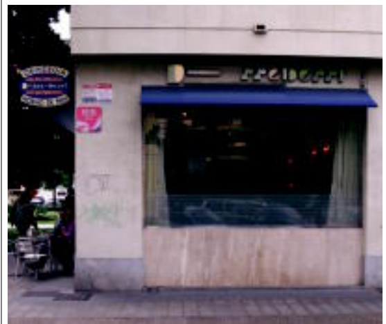
San Frantzisko pasealekuan dagoen Erre Berri okindegia. A. ETXANIZ

Bezeroei, beren fidelotasuna eskertzeko, pastelak eskuratzeko eskaintza berezia egingo die okindegiak