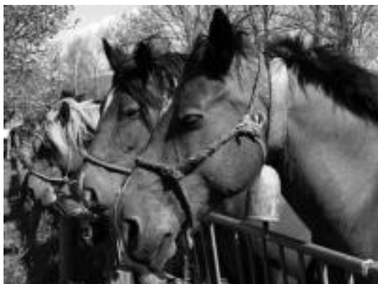
Harrapakariak ikuskizunaz gain, abereak izan ziren protagonista. IG