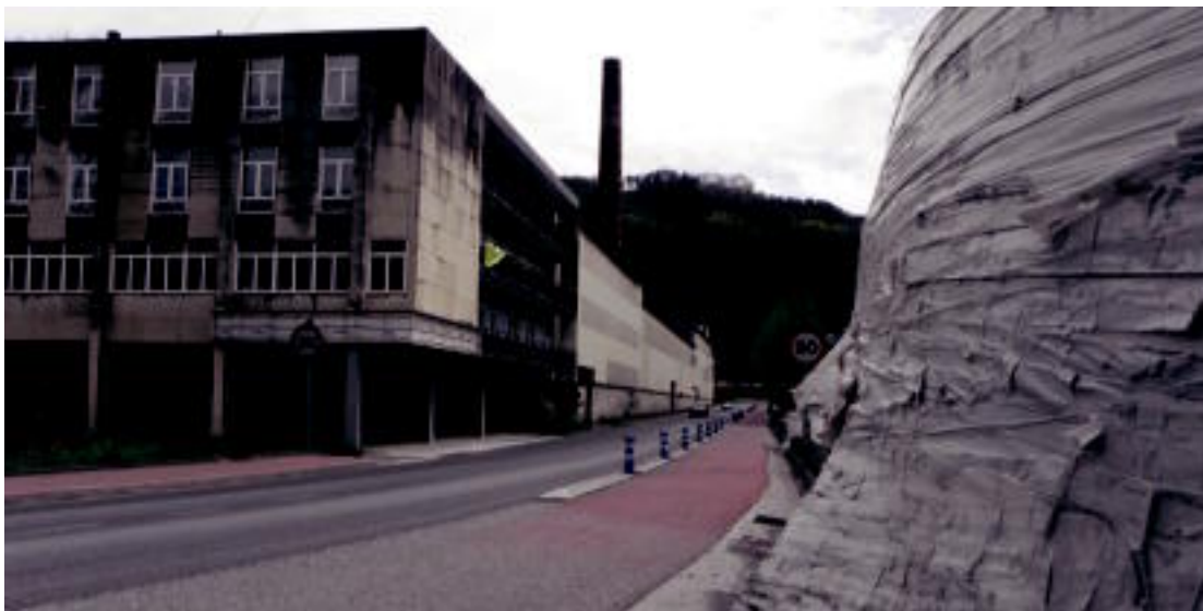
Legorretako Paperalia enpresaren instalazioak erosi zituen Amarozko paper fabrikak.