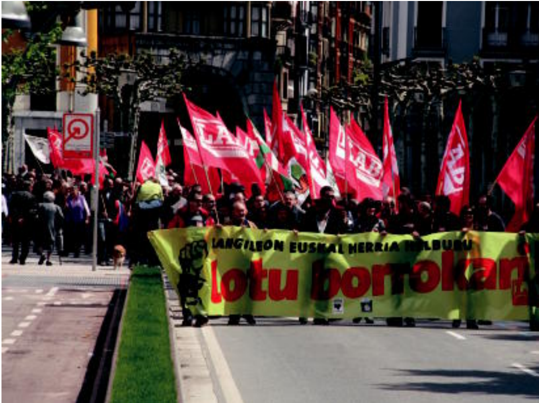
Jende asko bildu zen atzo, LAB sindikatuak Langilearen Nazioarteko Egunaren harira deitutako manifestazioan. I. URKIZU

Asteazkena, 2012ko maiatzaren 2a. IX. urtea. 2.341. zenbakia. tolosaldea.hitza.info