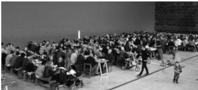
Adin guztietako jendea elkartu zen pilotalekuan; 180 lagun inguru izan ziren. E. MAIZ

jan ere bai. Urteak daramatzate, herritarren artean txekorra erretzen, eta aurten ere ez dute hutsik egin. Maiatzaren lehen eguna aprobetxatzen dute herritarrek, lagunak eta familiak elkartzeko egun polita igarotzeko. Herritarren artean egindako lana da. Gauean zehar, sua zainduz txekorra buelta eta buelta erretzen dute. Menuan, txorizo egosia, txekorra entsaladarekin eta postrea izaten dituzte tripa betetzeko. Aurretik, Aramako lore saltzailea izan zen plazan, eta udaberriko loreak erosteko aukera izan zuten.