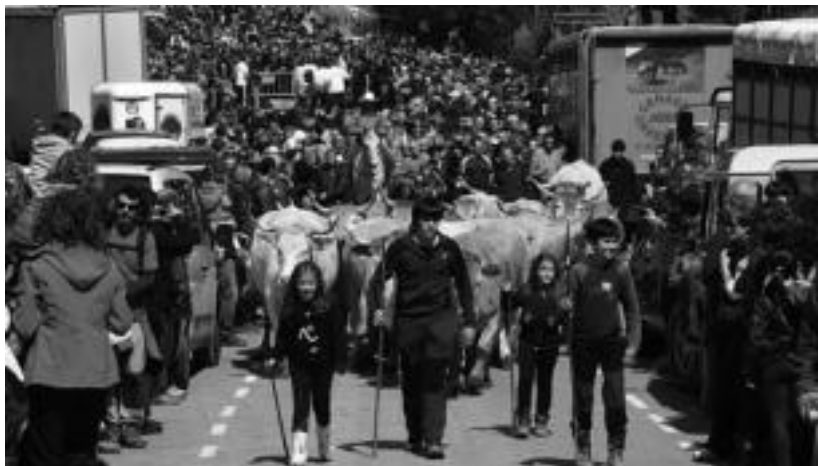
Larreak ireki zituzteneko unea; jendetza elkartu zen Larraitzen festa giroan murgiltzeko.

Idi pareta eta zaldiaren arteko lehia ere izan zen. Idiek 1.100 kiloko harria, eta zaldiak 1.000 kiloko