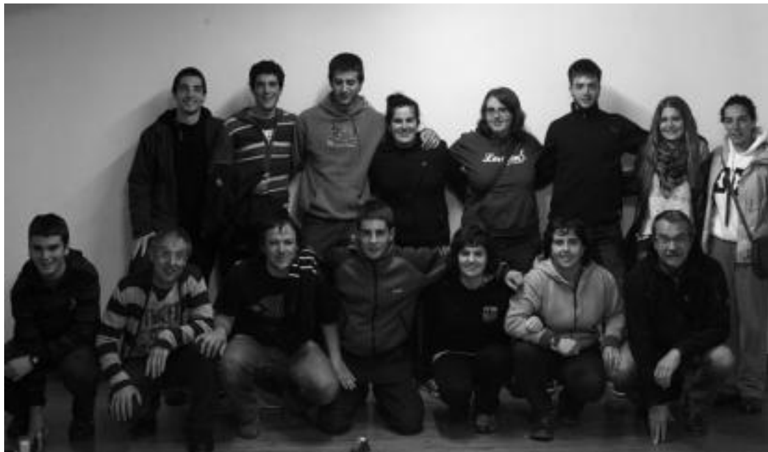
Ostegunero-ostegunero, ia 23 lagun elkartzen dira Lizardi elkartean, bertsoan ikasteko. I URKIZU

hura handitzen joan zen pixkana, eta ikasleen arteko maila ere desberdina zen. «Beste irakasle baten beharra antzeman zuten, eta