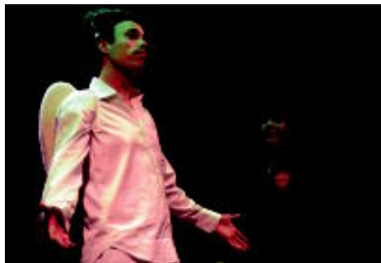
Bigarren kanporaketako lanetako baten irudia. MAFFASSANTI

gutzeko aukera eman nahi diete herritar guztiei, eta horregatik 21:00ak aldera irekitzen dituzte ateak. Gunea ezagutzeko aukera emateaz gain, zerbait hartzeko gonbita luzatzen dute zentroko arduradunek, eta baita kanporaketak bukatu ondoren bertan geratu eta festa luzatzeko ere. Saioak 00:30ak aldera bukatu ohi dira.