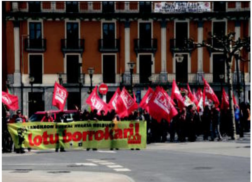
Manifestazioa 12:00etan abiatu zen Triangulua plazatik, Tolosaldeko eta Goierriko langileekin.

Honen guztiaren aurrean, «bide bakarra» ikusten dutela azpimarratu zuten bertaratuek: «Euskal Herria eta euskal herri-