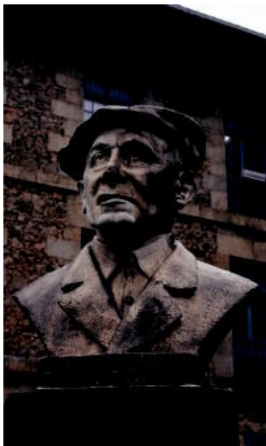
Pello Errota bertsolaria omentzen duen monolitoa, plazan. I. URKIZU