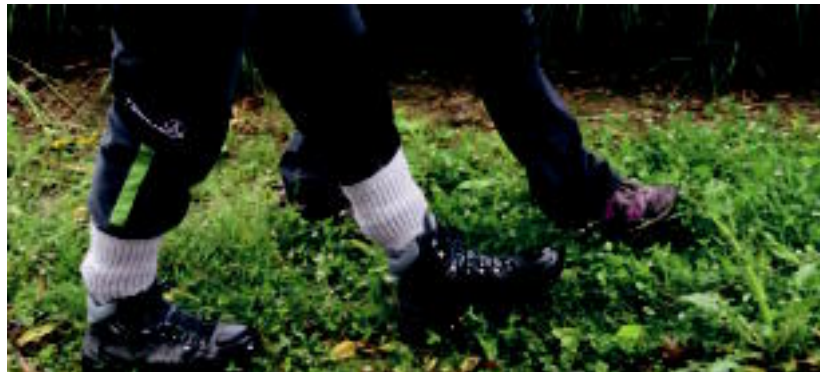
Oinetako egokiak izatea, eta orkatilak ongi lotuta eramatea komeni da. M.S.

ria izatean gorputzarentzat alarma bat pizten da, edan egin behar da. Neurrian jatea ere garrantzitsua da».