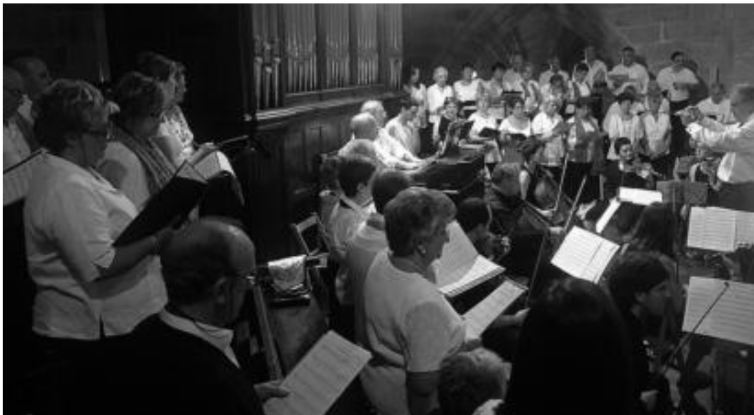
Santa Maria parrokiako musika kapera, Euskal Herriko erakunde musikalki zaharretarikoa da. HITZA