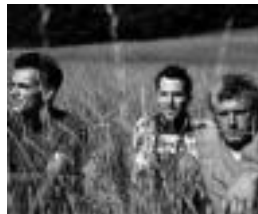
Triz3ps-eko kideak.

hainbat taldetako musikari izan baitira hirurak. Triz3ps-ekin, benetako doinu instrumentalen alde egin dute, elektronikaren kutsurik gabe. Makinen menpe dauden kontzertuetatik alde eginaz, inprobisazioarekin jotzen dute eszenatokian.