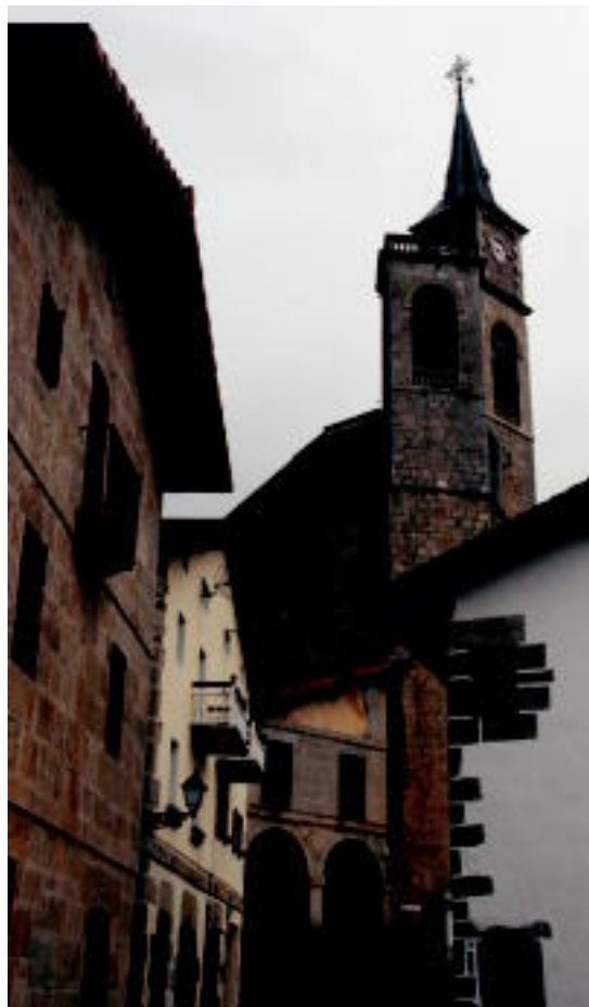
Simonen jaitsiera elizako kanpandorretik egiten dute, urtero. I. URKIZU