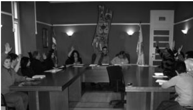
Amasa-Villabonako udalbatzak, ohiko osoko bilkura egin zuten herenegun. A. IMAZ